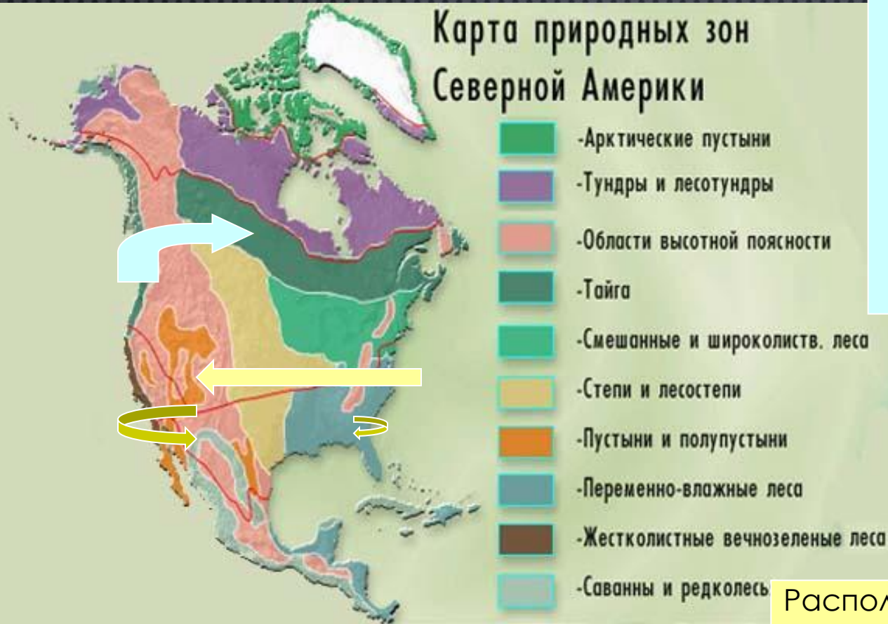
Карта природных зон Северной Америки

Расположение природных зон Арктических пустынь, Тундры, лесотундры тайги подчиняется закону широтной зональности