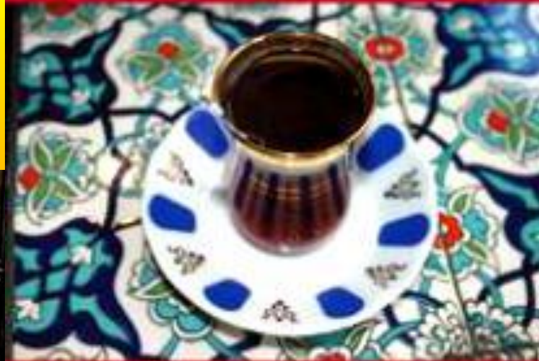
İsmail Paşa'nın Çayhanı Çayhanı