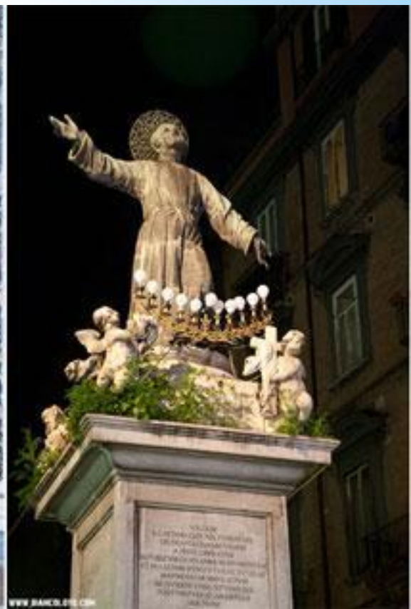
Базлика Сан Паоло Маджоре. Неаполь. Кампания.