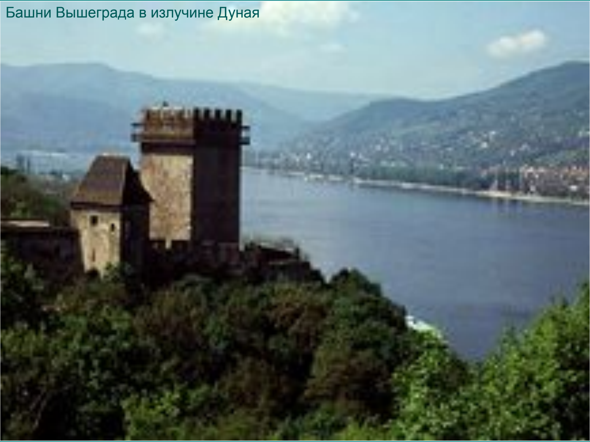
Башни Вышеграда в излучине Дуная