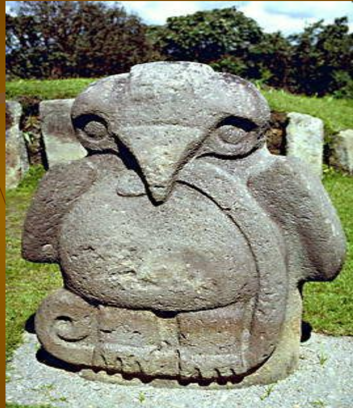
Каменная статуя птицы со змеей. Археологическая культура индейцев Сан-Агустин. Ок. 400 г. Национальный археологический парк, Сан-Агустин, Колумбия.