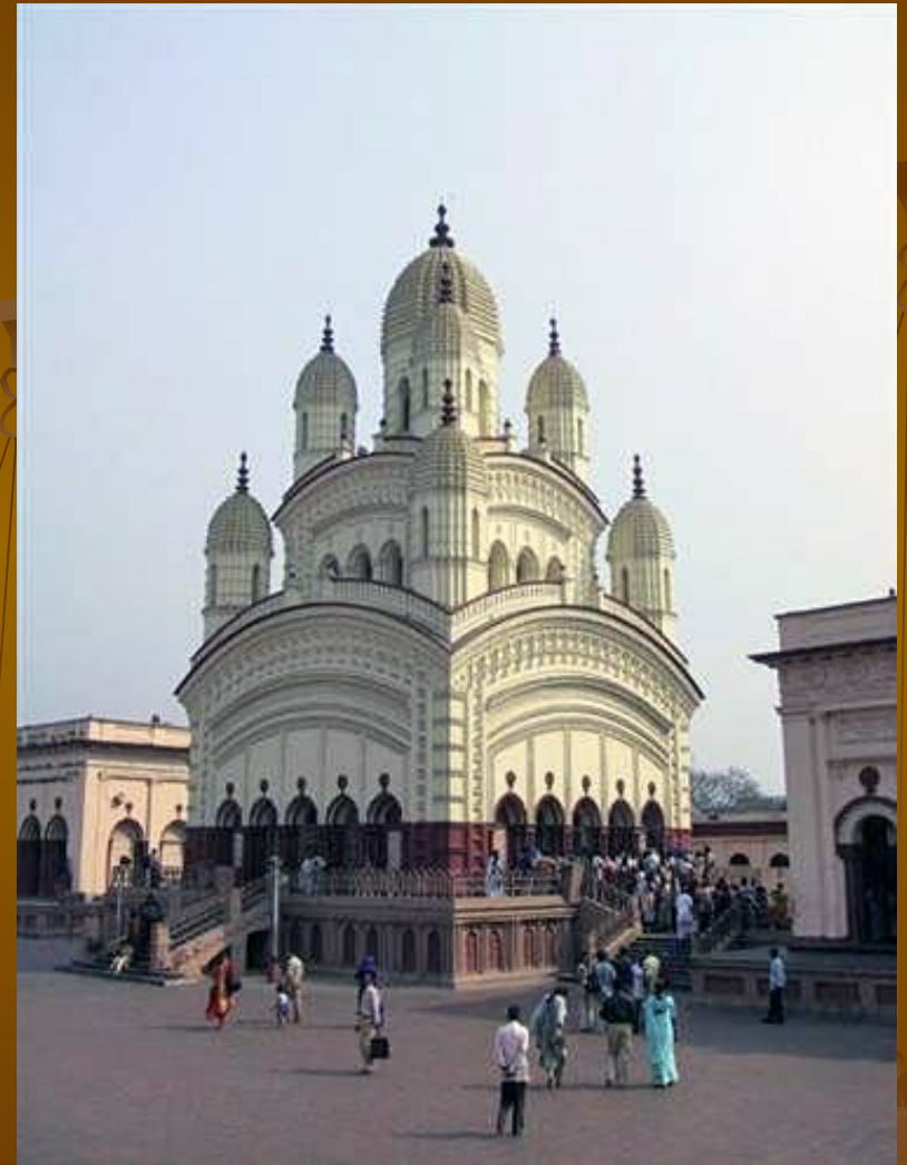
Дакшинешварский храм Кали. Калькутта.