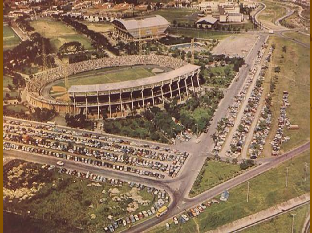
Спортивный центр «Атанасио Хирардот»