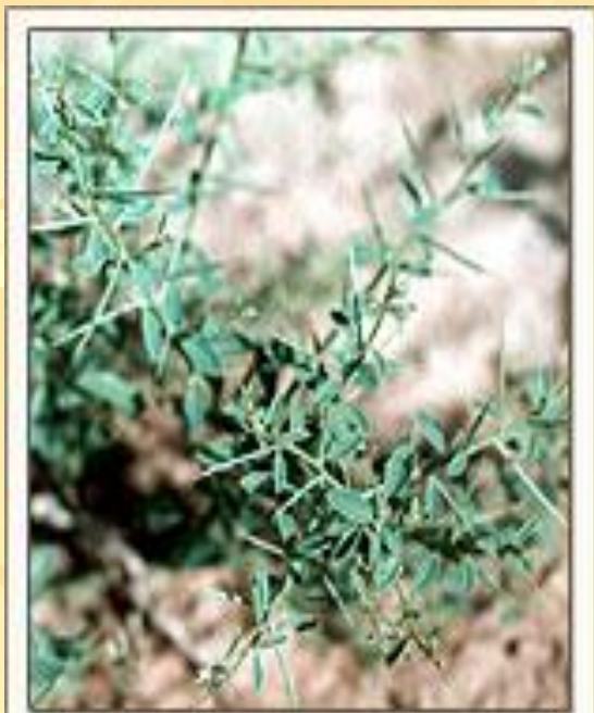
Верблюжья колючка обыкновенная Alhagi pseudalhagi Fisch.