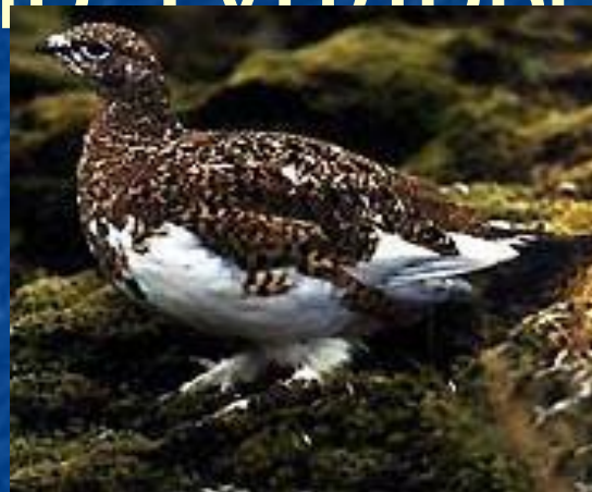
белая куропатка в период линьки