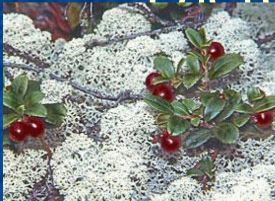
ягель (олений лишайник)