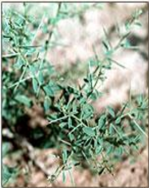
Верблюжья колючка обыкновенная Alhagi pseudalhagi Fisch.