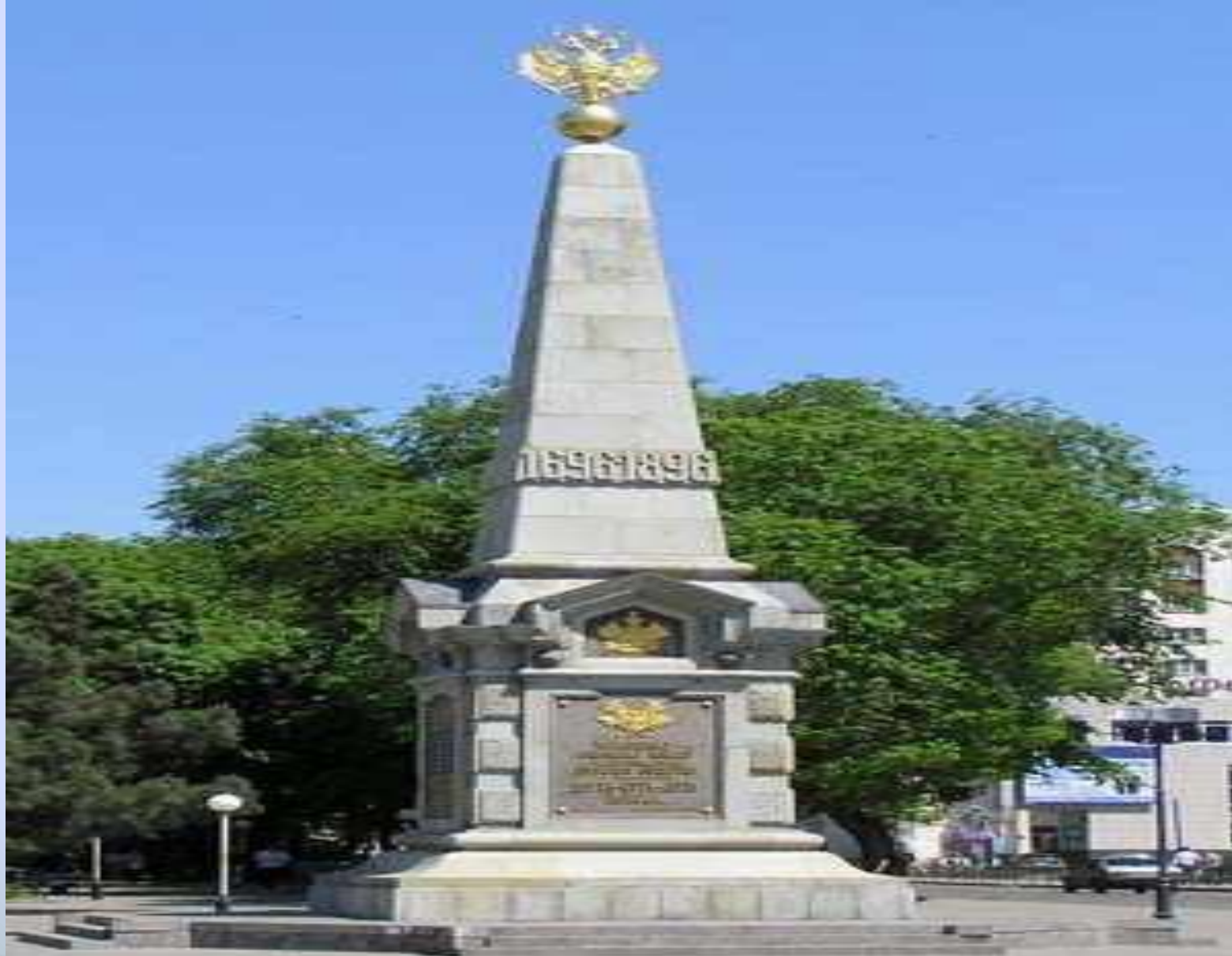
Памятник в честь 200-летнего юбилея Кубанского казачьего войска.