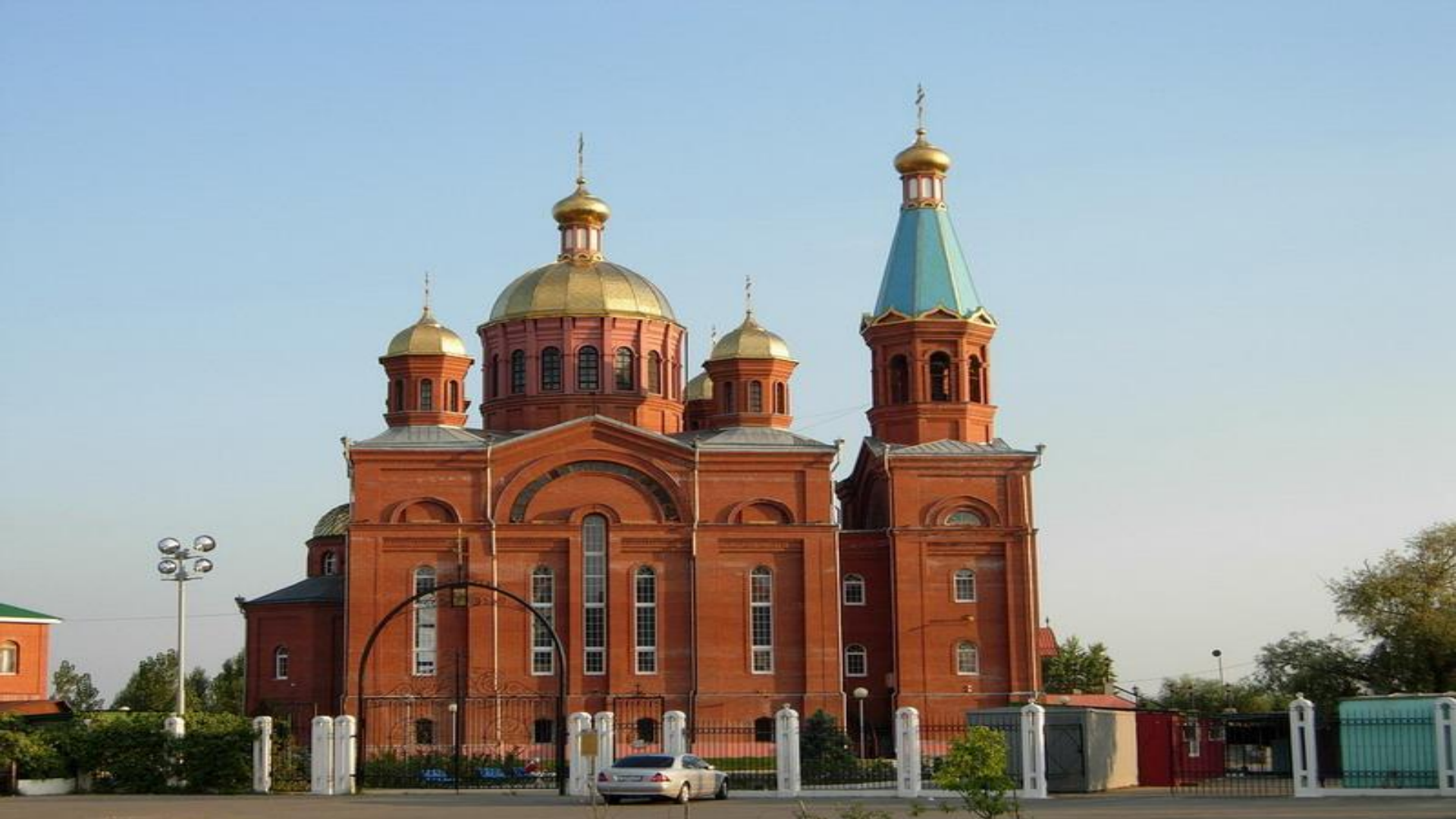
храм Рождества Христова в Юбилейном микрорайоне