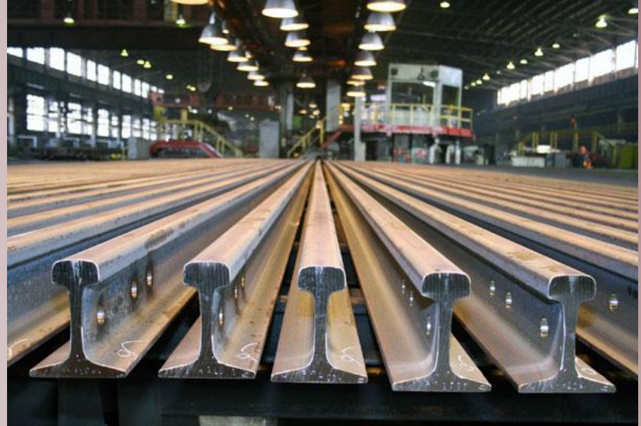
В рельсобалочном цехе Новокузнецкого металлургического комбината