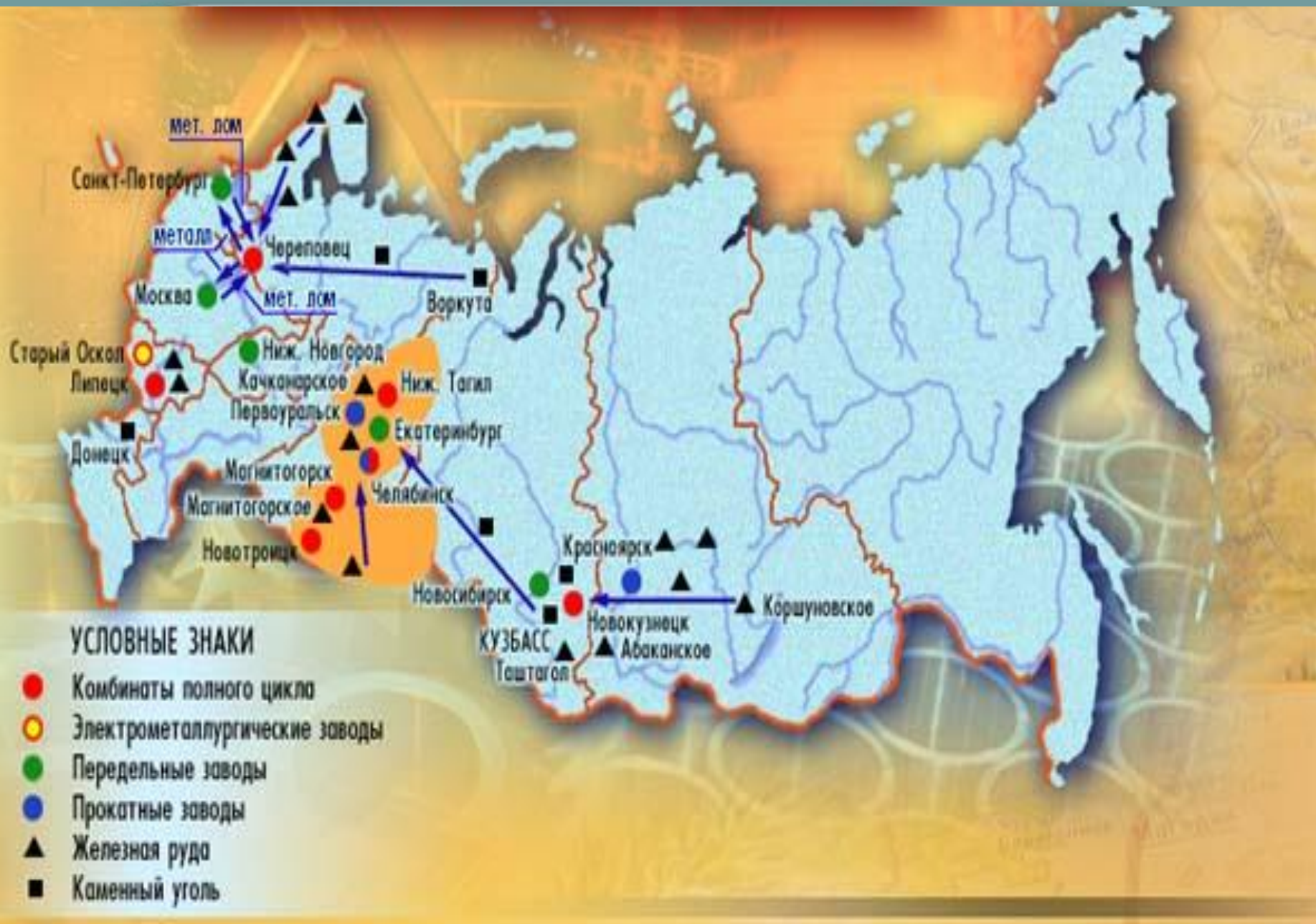
География черной металлургии России