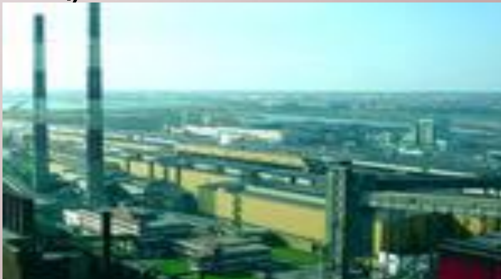
Новокузнецкий металлургический комбинат