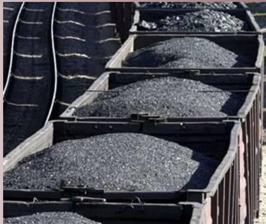
Перевозка угля по железной дороге