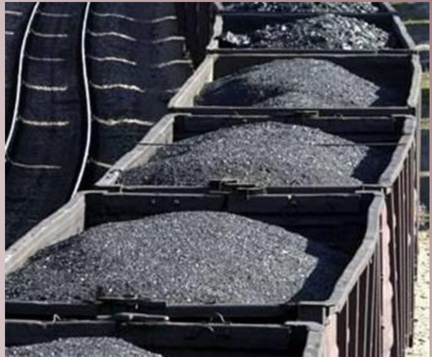
Перевозка угля по железной дороге