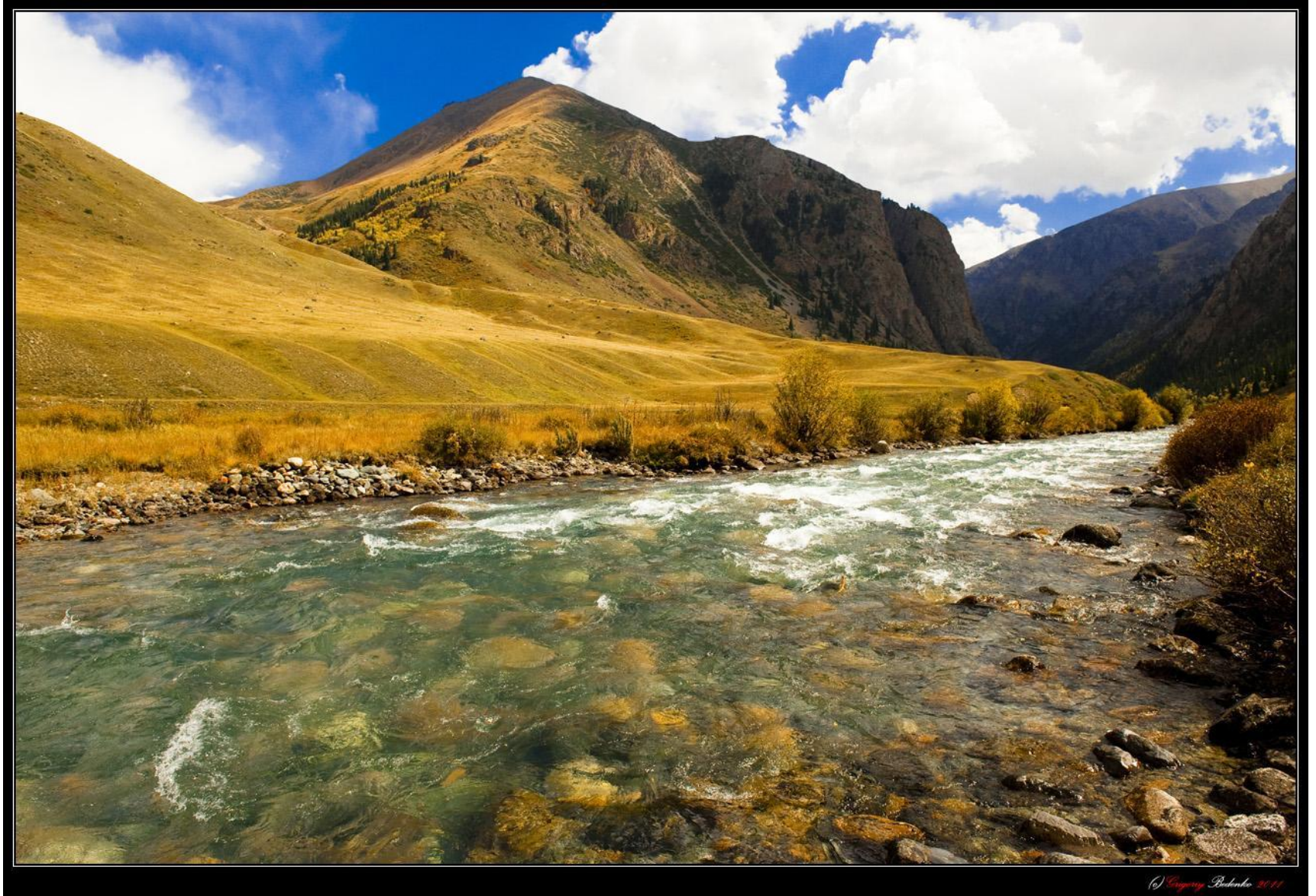
Джунгарский Алатау. Пограничная река Хоргос.