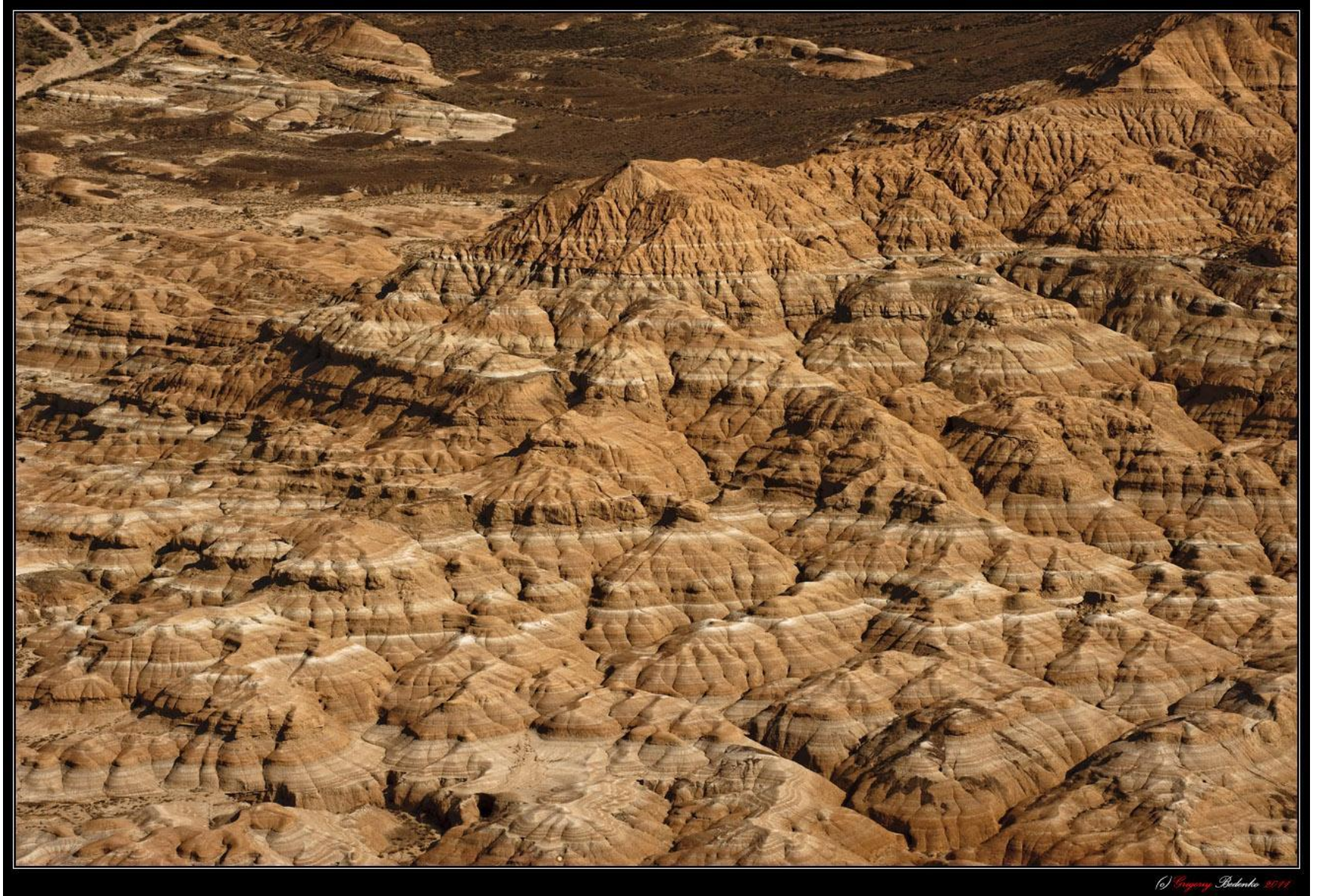
Казахстанский вариант "Марса на Земле". Гибридные структуры из песчаника и известняка в низовьях реки Чарын.