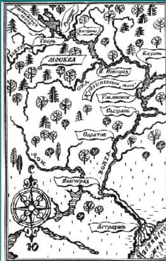
Средновековная карта Волги