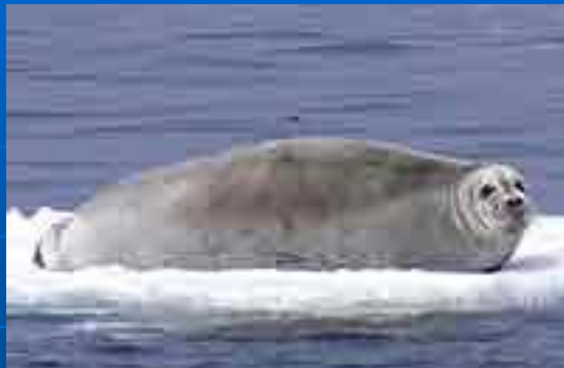
Морской заяц Морской заяц