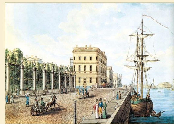
Набережная Невы у летнего сада Рисована автором 1820-е.

1) место расположения , от которого зависит удобство доступа к отелю и привлекательность его окружения (инфраструктуры) для гостя, которая зависит во многом и от цели посещения.