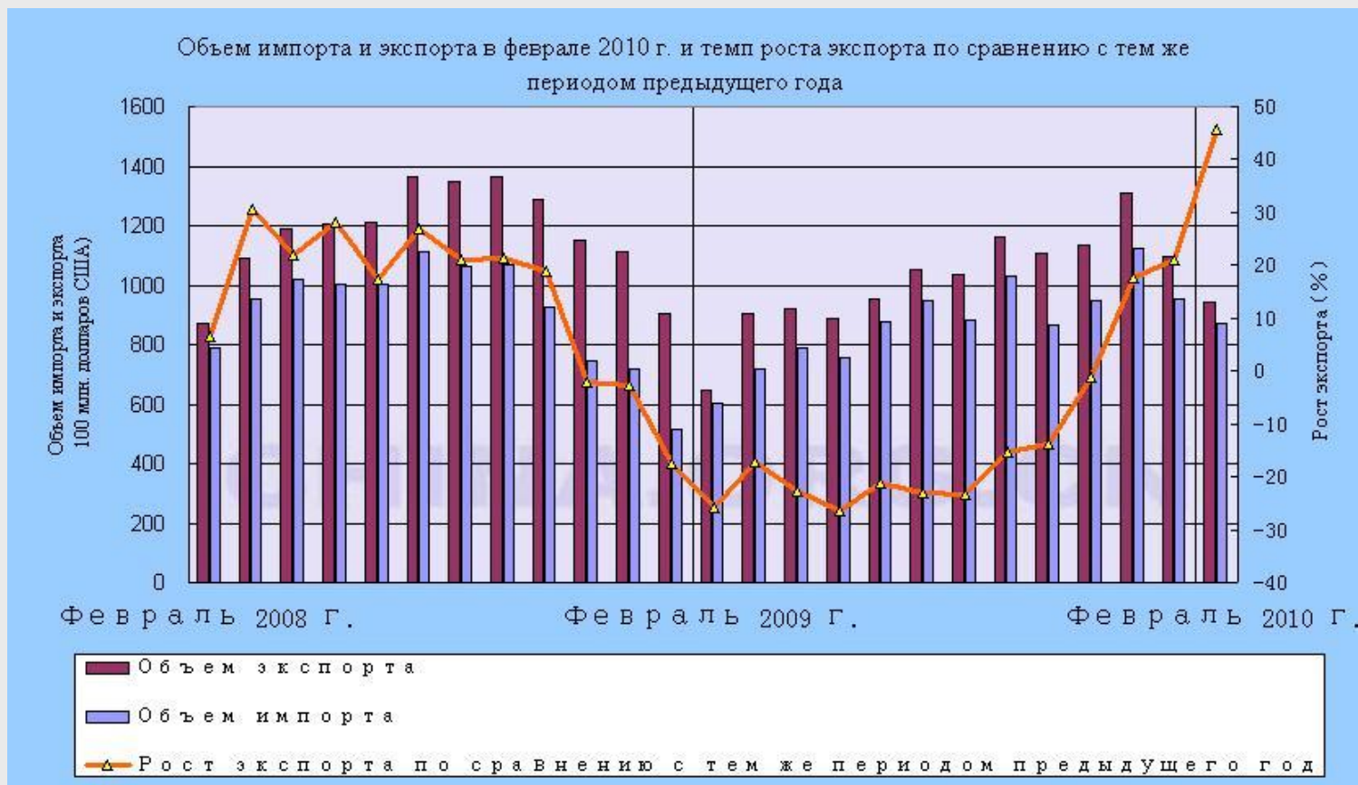
Рис. №1 Объем экспорта и импорта Китая