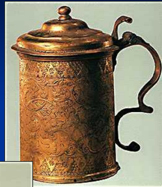
Кружка. Нижнетагильский завод. Медь. 1750 год.