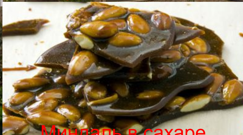
Миндаль в сахаре