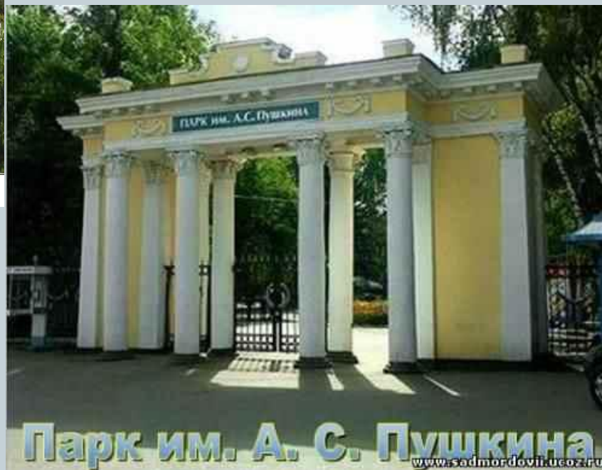
Парк им. А. С. Пушкина