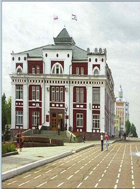
Здание городской администрации в Саранске