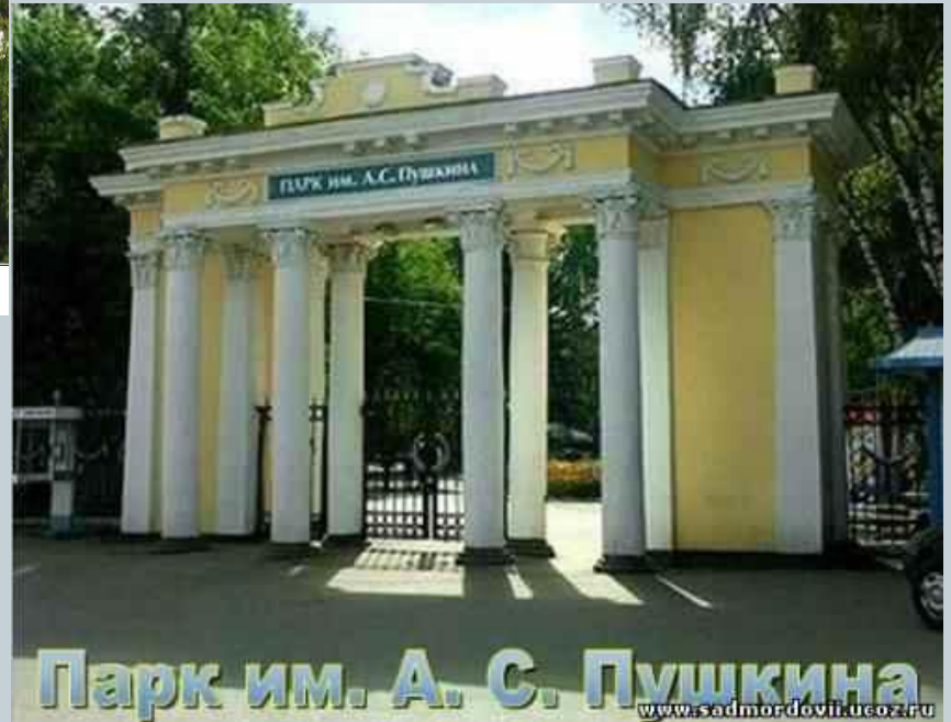
Парк им. А. С. Пушкина www.sadmordovii.ucoz.ru