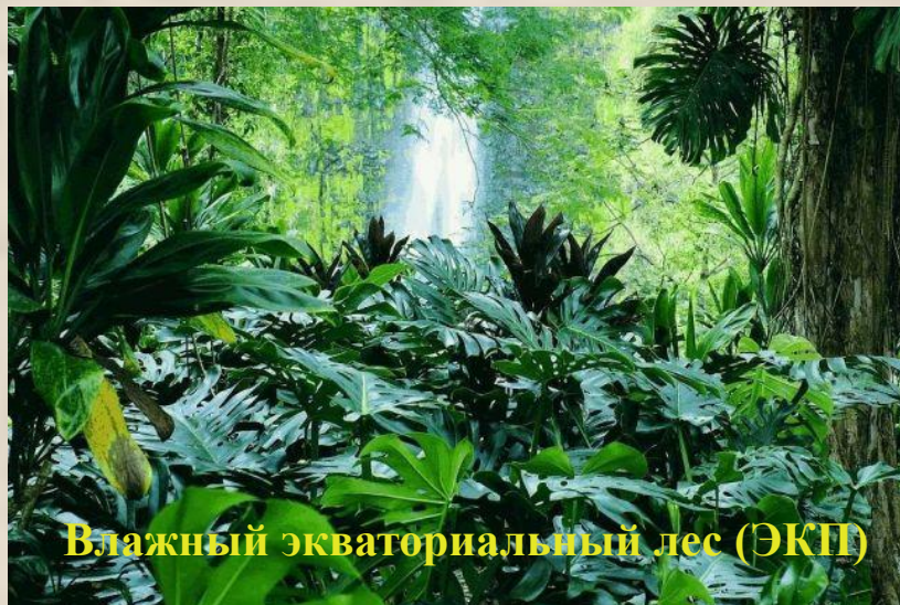
Влажный экваториальный лес (ЭКП)