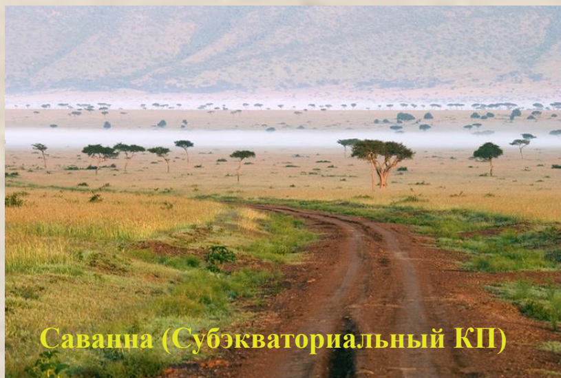
Саванна (Субэкваториальный КП)