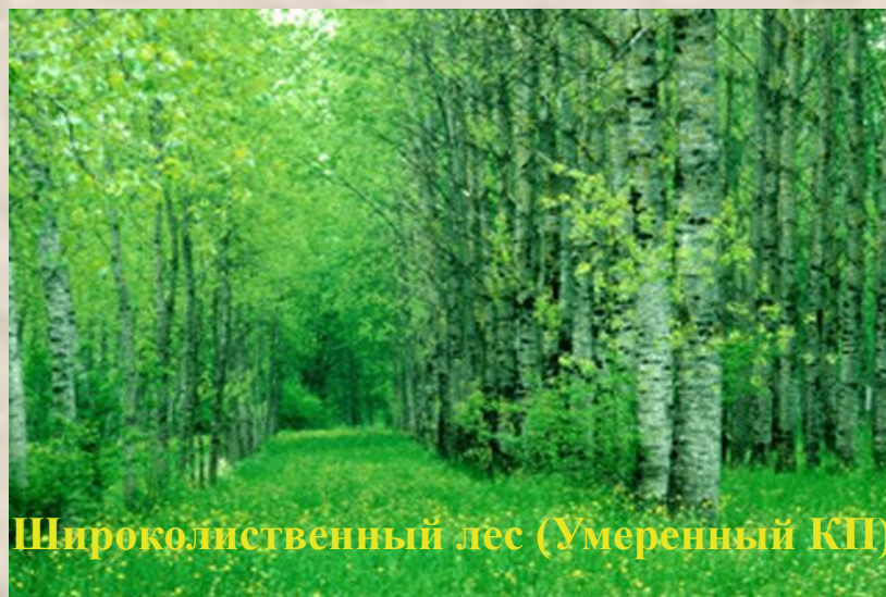
Широколиственный лес (Умеренный КП)