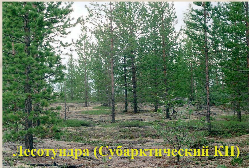
Лесотундра (Субарктический КП)