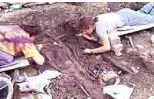
Раскопки возле Гутенберга