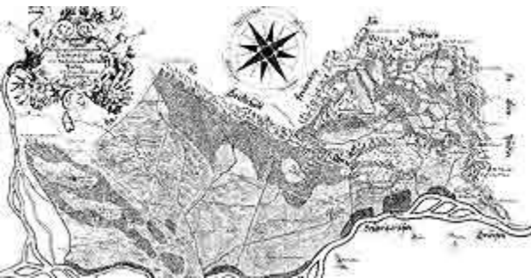
Старинная карта княжества

Территория современного Лихтенштейна была заселена еще в ранний период каменного века. В 15 году до н. э. территория была освоена римлянами, однако уже в V в. н.э. они были вынуждены уступить ее германским племенам. В средние века здесь господствовали представители нескольких знатных родов. Лишь в 1396 году оформился государственный статус графства Вадуц.