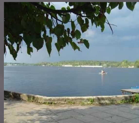
Отдых на Гусевском озере