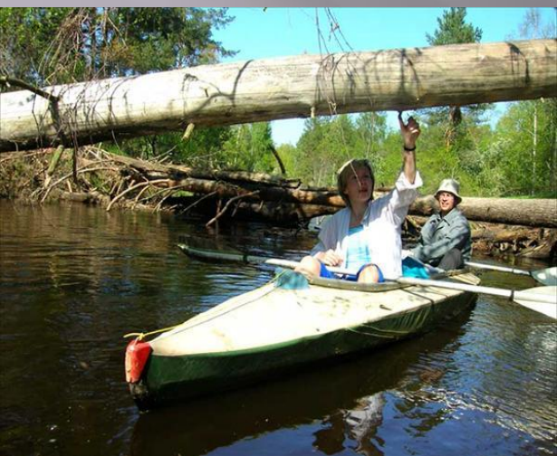
Спуск по реке Гусь

В Гусь-Хрустальном развиты многие виды туризма. Рекреационный, спортивный, экскурсионный – здесь вы найдете отдых для себя.