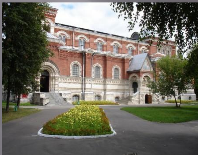
Посещение Музея Хрусталя