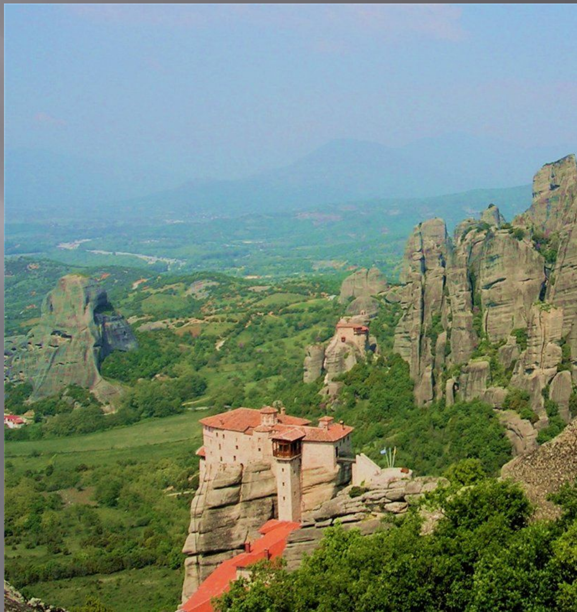
Монастырь Русану или святой Варвары