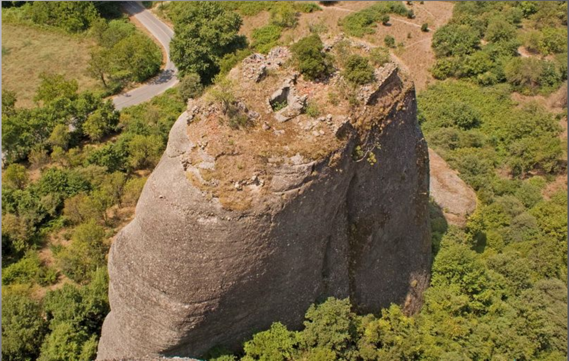
▣ Руины монашеского жилища