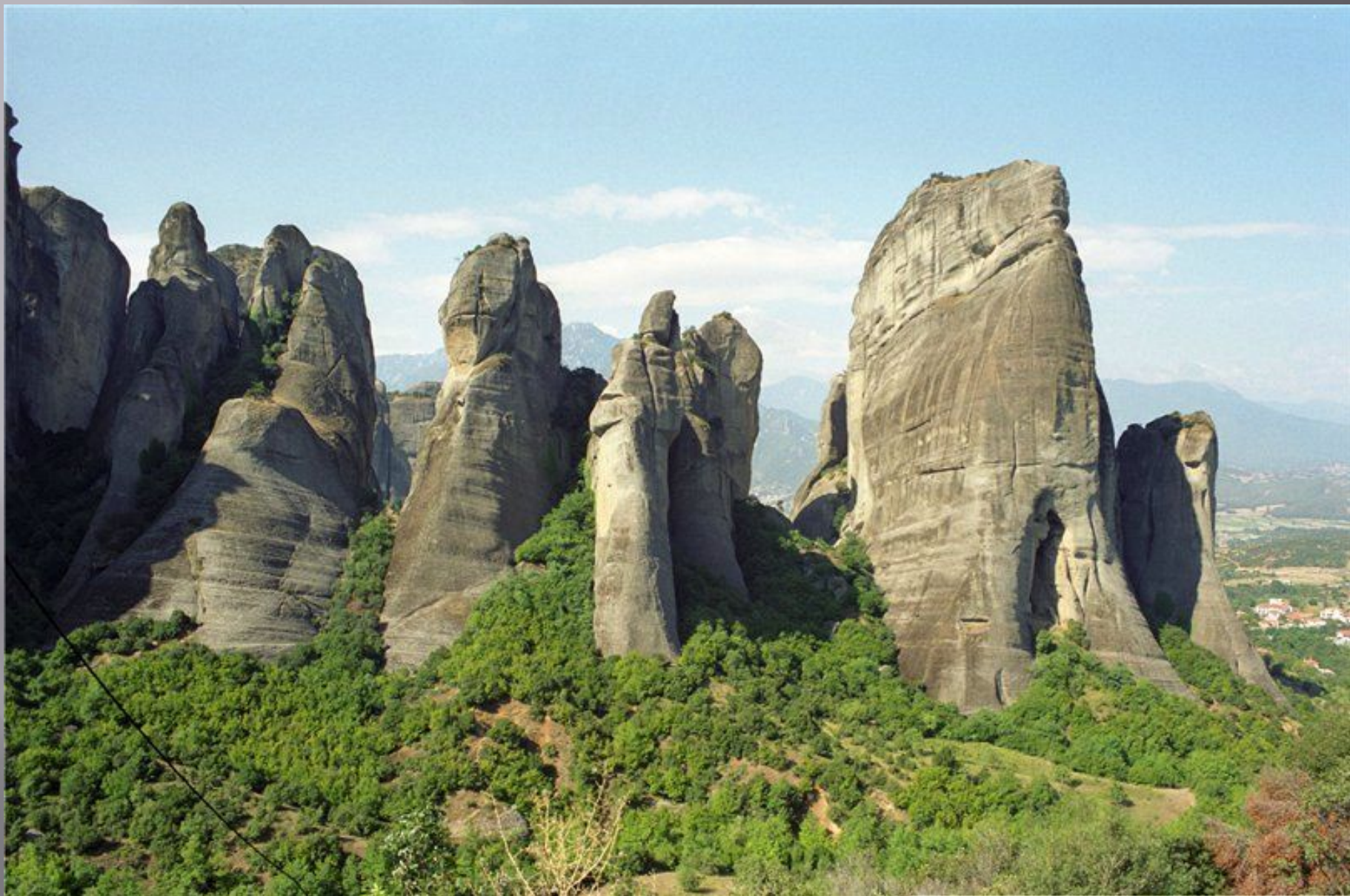
▣ Скалы, на которых расположены монастыри, и вид на Фессалийскую равнину