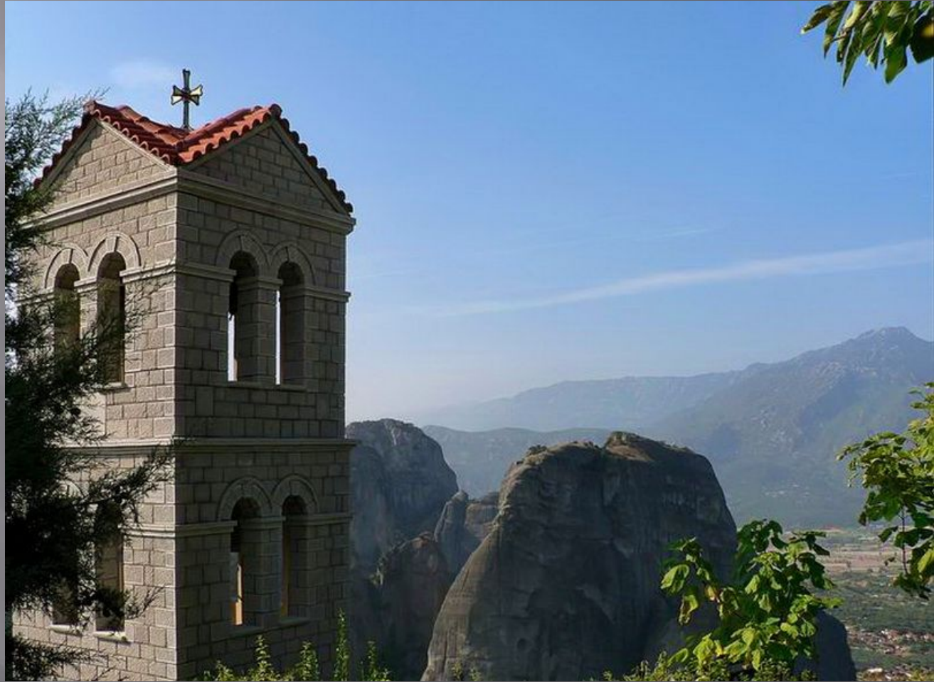
Звонник ( колокол )