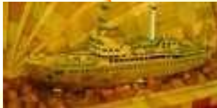
Модель атомохода «Ленин»