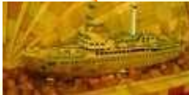
Модель атомохода «Ленин»