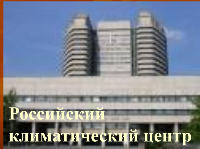
Российский климатический центр

■ Основа мониторинга климата - метеорологические данные. Научные учреждения Росгидромета на основе оперативных наблюдений готовят бюллетени, отражающие изменение ситуации за определенный период. Месячные бюллетени "Данные мониторинга климата" начали выходить в 1984 году, а в 1997-м появился первый годовой бюллетень "Изменения климата России".