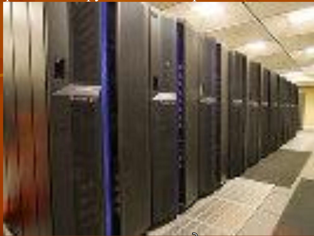
Современные компьютеры для вычисления климата

■ Очевидно, что изменения климата серьезно влияют на хозяйственную деятельность человека в самых разных областях, от сельского хозяйства до энергетики. Чего ждать от повышения среднегодовой температуры - засухи, пыльных бурь или, наоборот, наводнений и подтопления территорий? Чтобы сделать прогноз возможных последствий, нужно в первую очередь располагать точной и надежной информацией. Для этого во всех развитых странах создаются системы мониторинга - непрерывного слежения за климатом. Задача таких систем - собрать и обобщить климатические данные, оценить серьезность текущих изменений и, что очень важно, своевременно довести полученную информацию до руководящих органов и общественности.