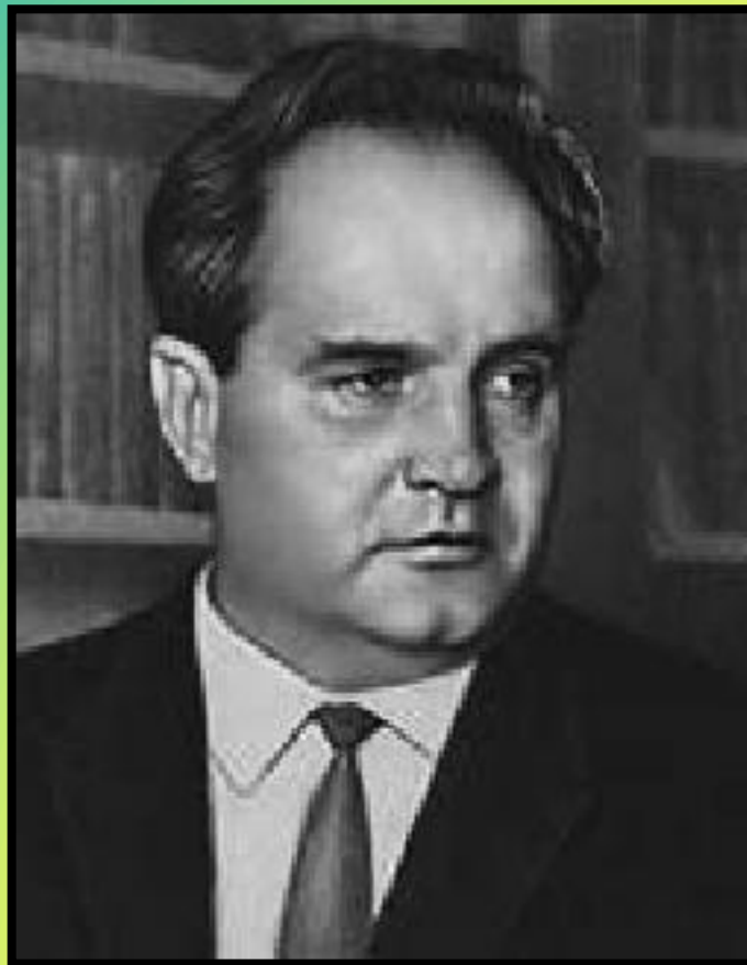
Сергей Сергеевич Наровчатов

В честь какого знаменитого академика названа одна из улиц города?