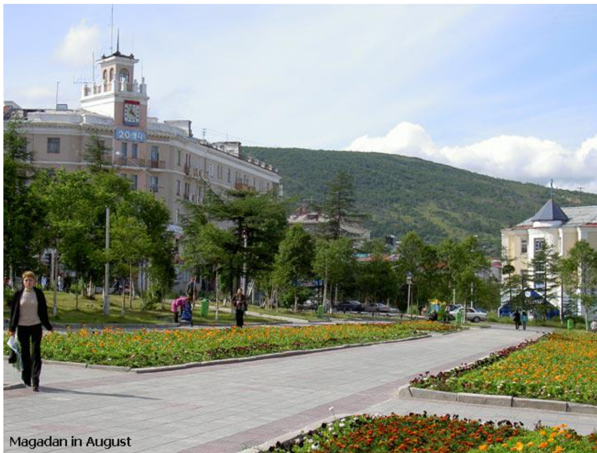
Magadan in August