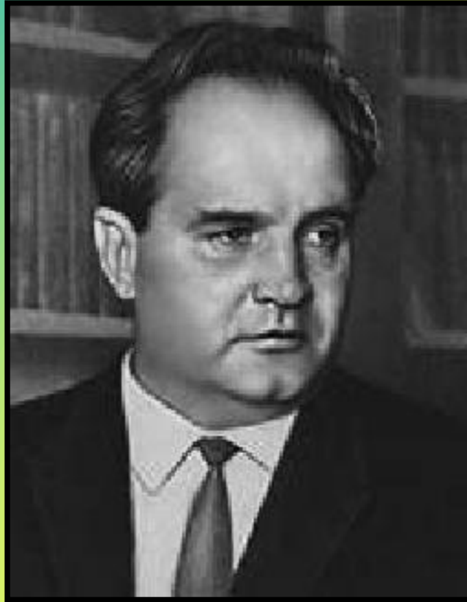
Сергей Сергеевич Наровчатов

В честь какого знаменитого академика названа одна из улиц города?