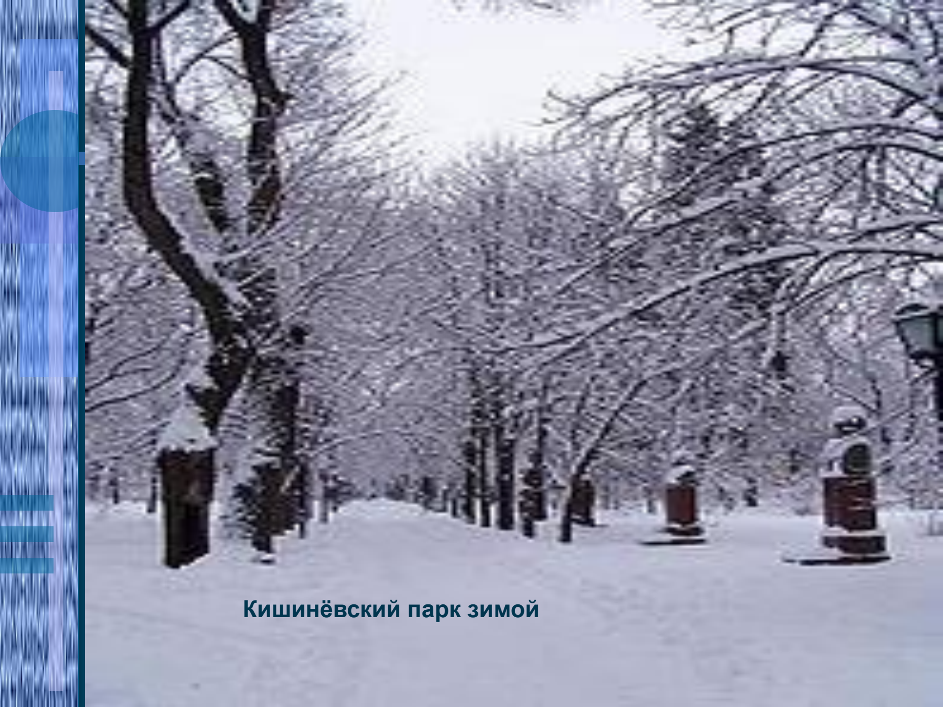
Кишинёвский парк зимой