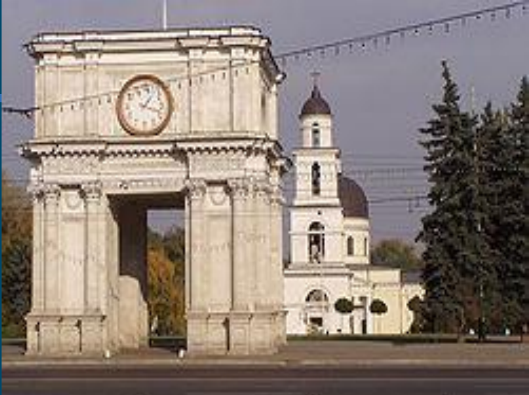
Триумфальная арка и православный кафедральный собор в центре Кишинёва