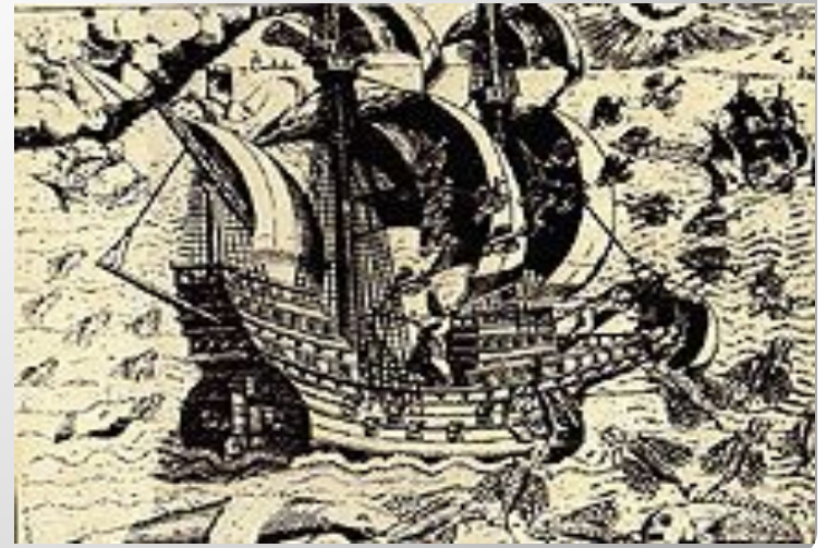
Каравеллы Христофора Колумба

В 1476—84 жил в Лиссабоне и на португальских островах Мадейра и Порту-Санту. Опираясь на античное учение о шарообразности Земли и на неверные расчёты учёных 15 в., Колумб составил проект западного, по его мнению кратчайшего, морского пути из Европы в Индию.