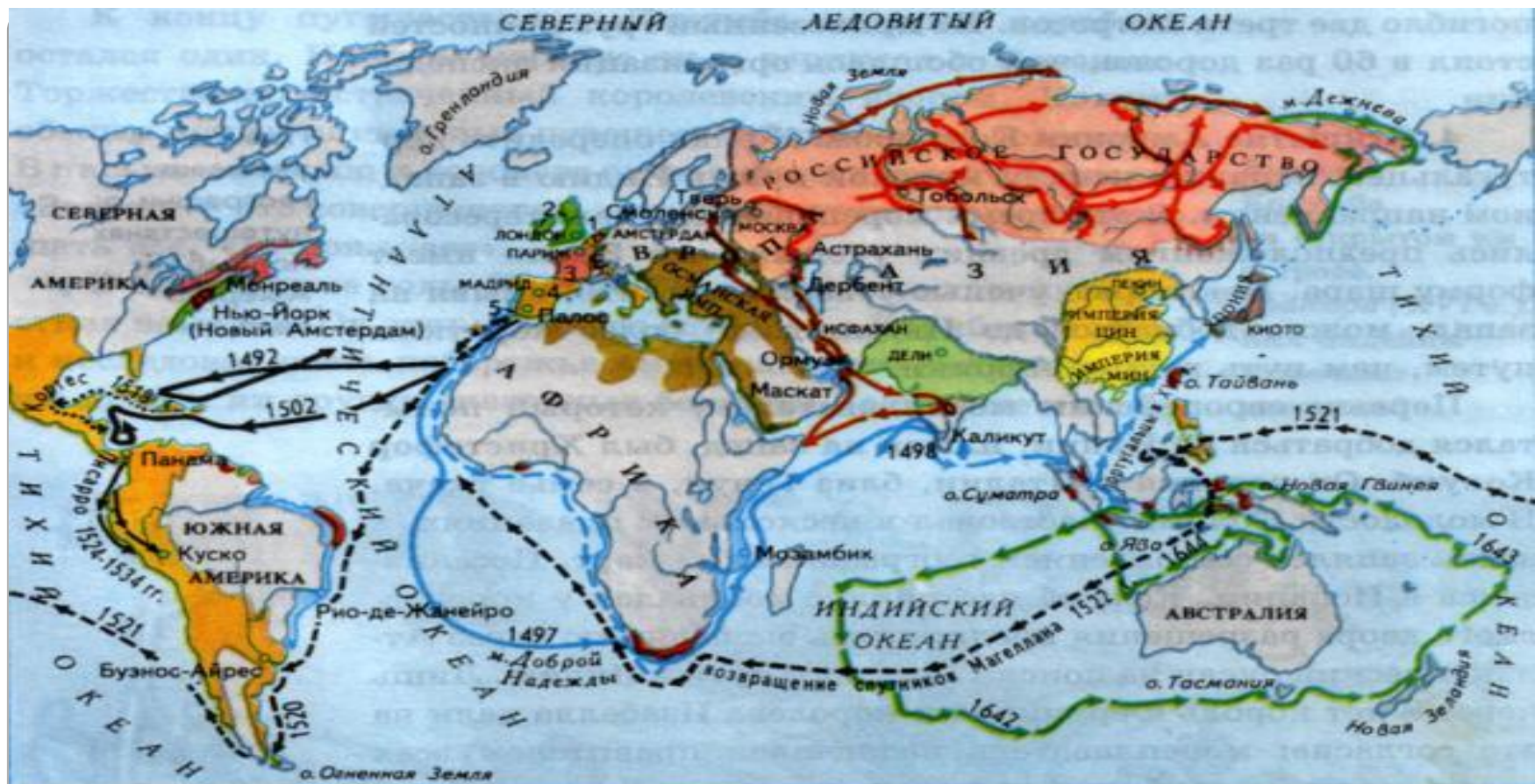
Маршруты важнейших путешествий в XV-середине XVII в.