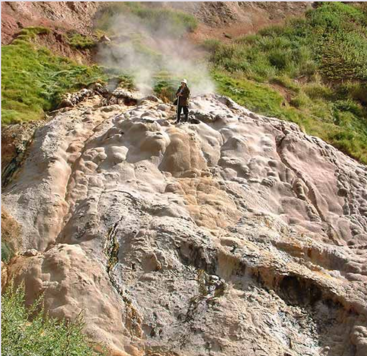
«Тройной» фонтанирует сразу из трех отверстий.