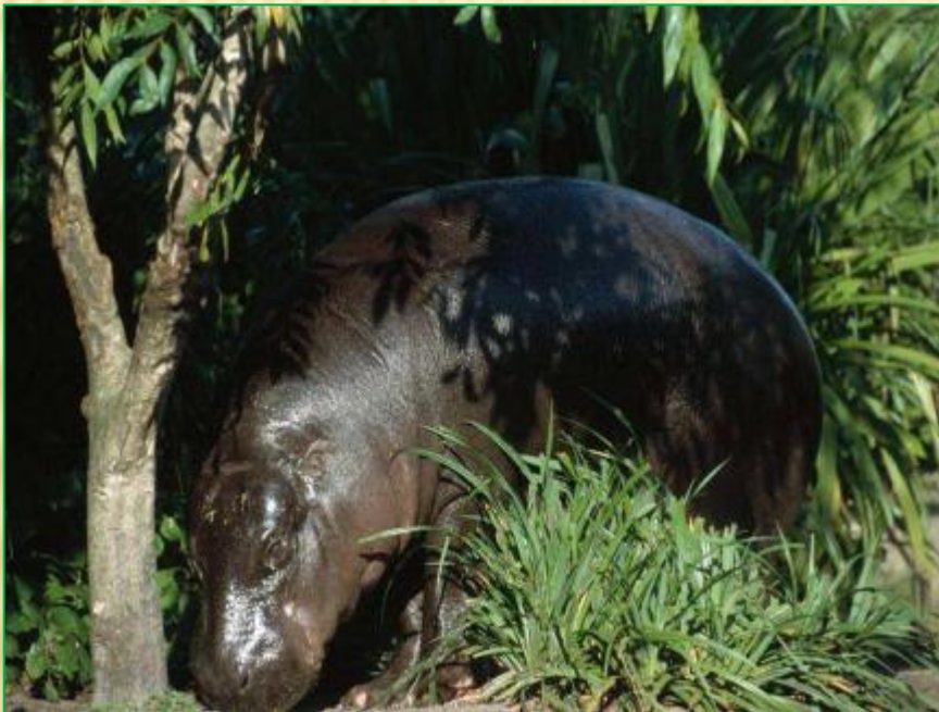
Карликовый бегемот до 80 см.