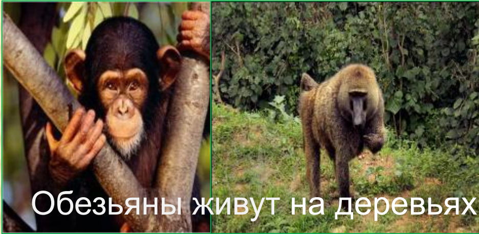
Обезьяны живут на деревьях