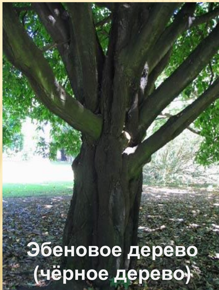
Эбеновое дерево (чёрное дерево)