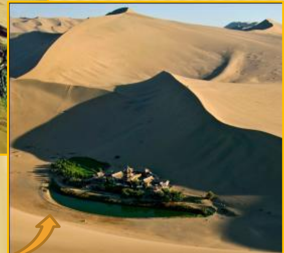
Оазис в пустыне