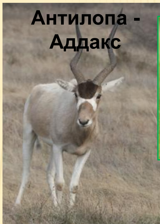
Антилопа - Аддакс