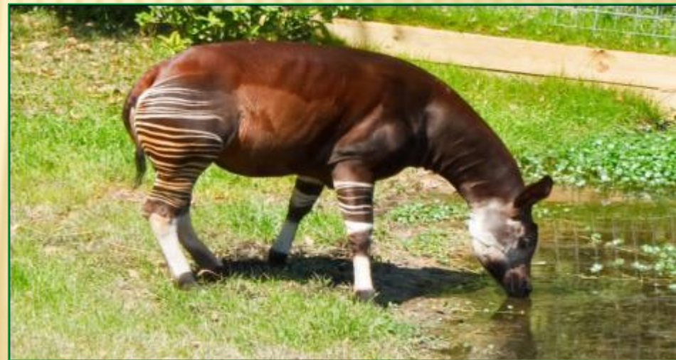
Окапи, обитают только в Африке