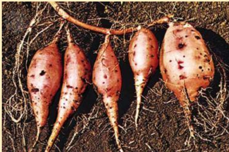
Сладкий картофель, он же батат