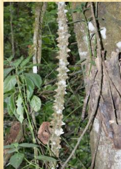
Лианы, свисая гирляндами, делают лесную чащу непроходимой