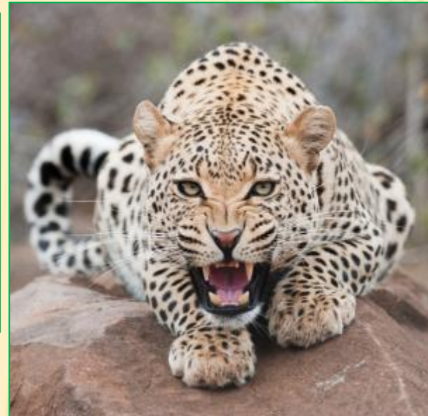
Леопард— хищное животное