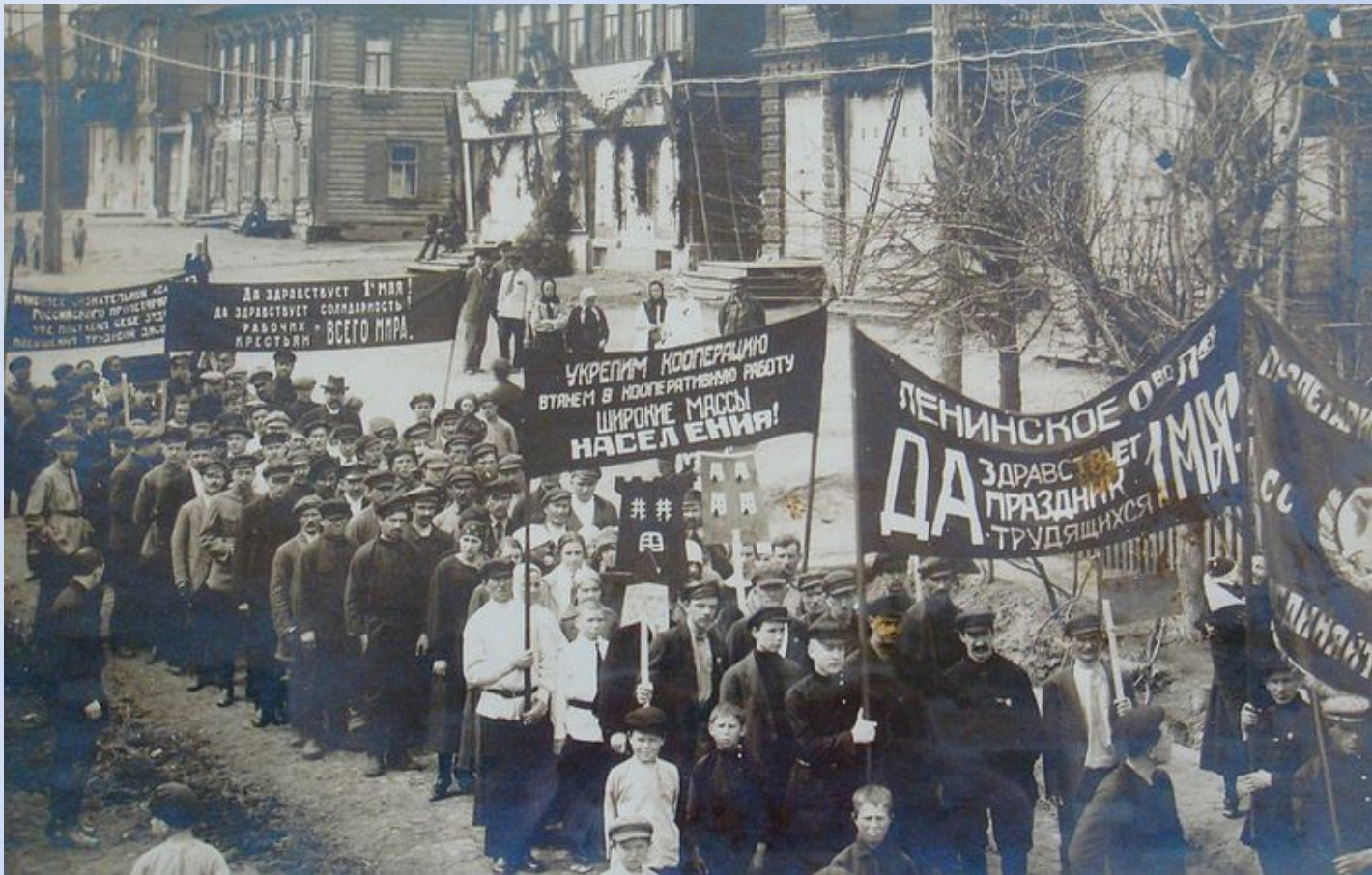
Майская демонстрация в Ленинске. Середина 1920-х годов.