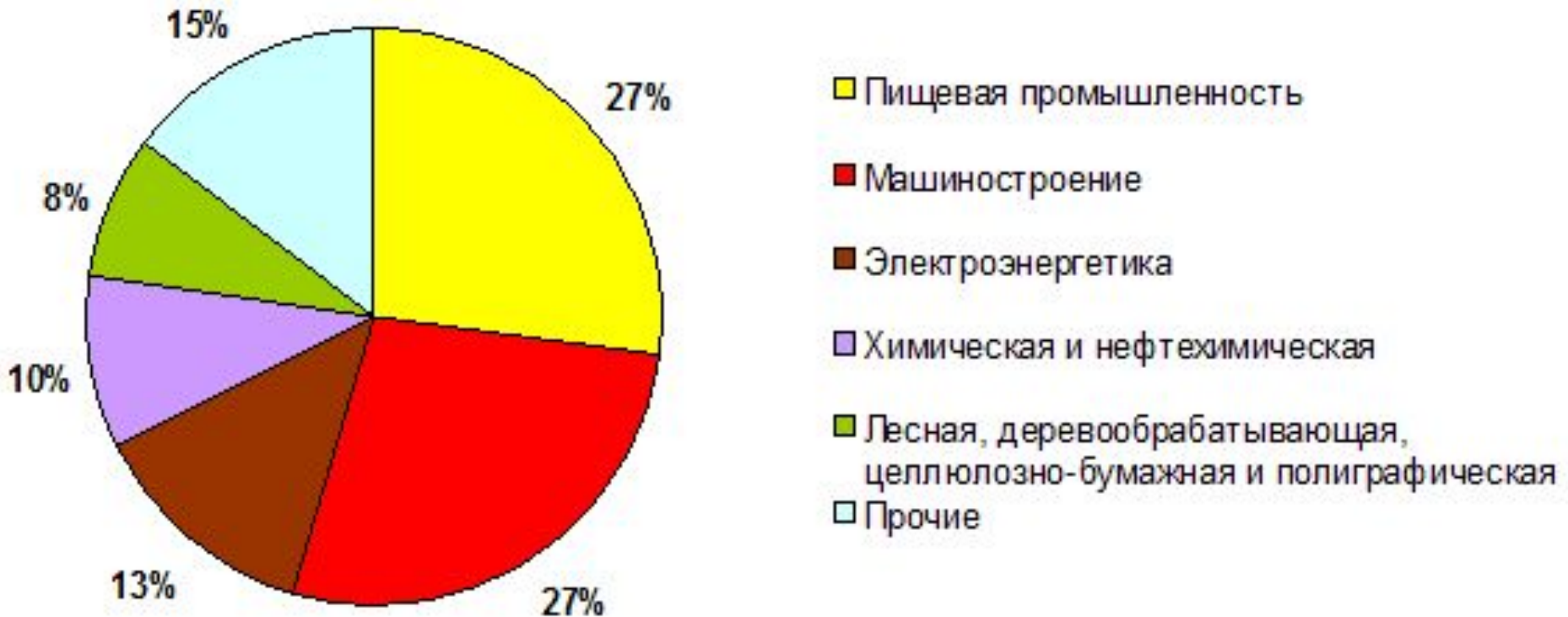
Отраслевая структура промышленности Пензенской области, 2005 г.

Наибольший удельный вес продукции от ее общего объема приходится на предприятия машиностроения и металлообработки (29,5%), пищевой промышленности (24,9%).