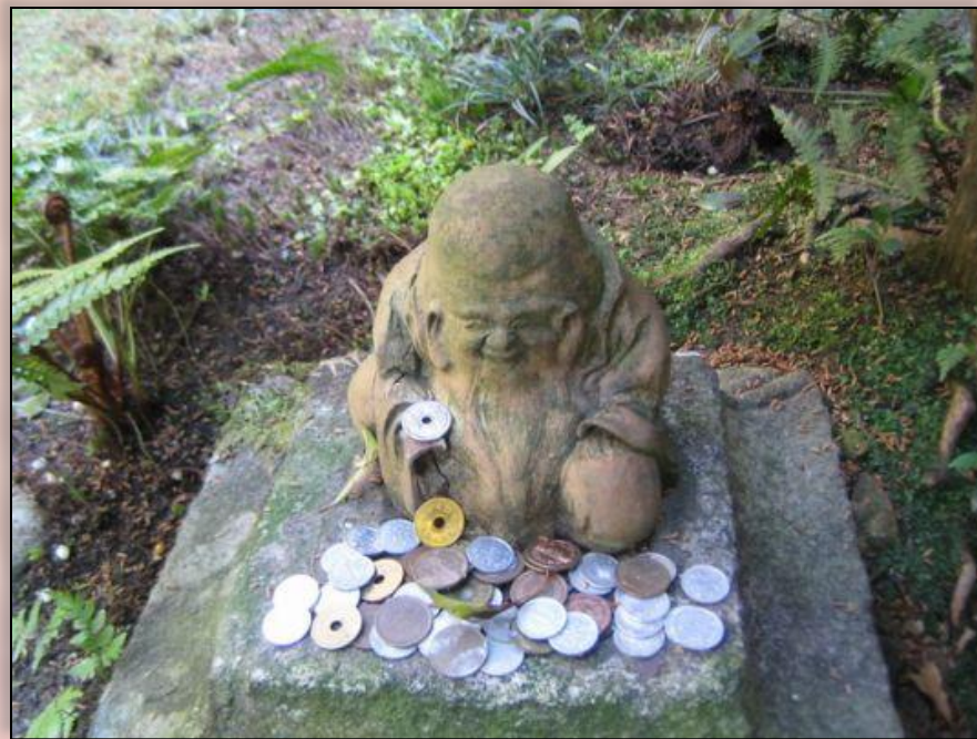
Рисунок этот сопровождал статью о финансовом положении Японии, о том, что она стала главным кредитором в мире.

Маленький человечек с раскосыми глазами восседал на куче денег. С гордостью и удивлением взирал он на обступивших его людей, которые, протягивали к нему руки, просили: «Дай! Дай!». Это представители разных континентов. Лица у них то белые, то смуглые, то совсем темные, волосы тоже разные: американским ежиком, то по-африкански курчавые.