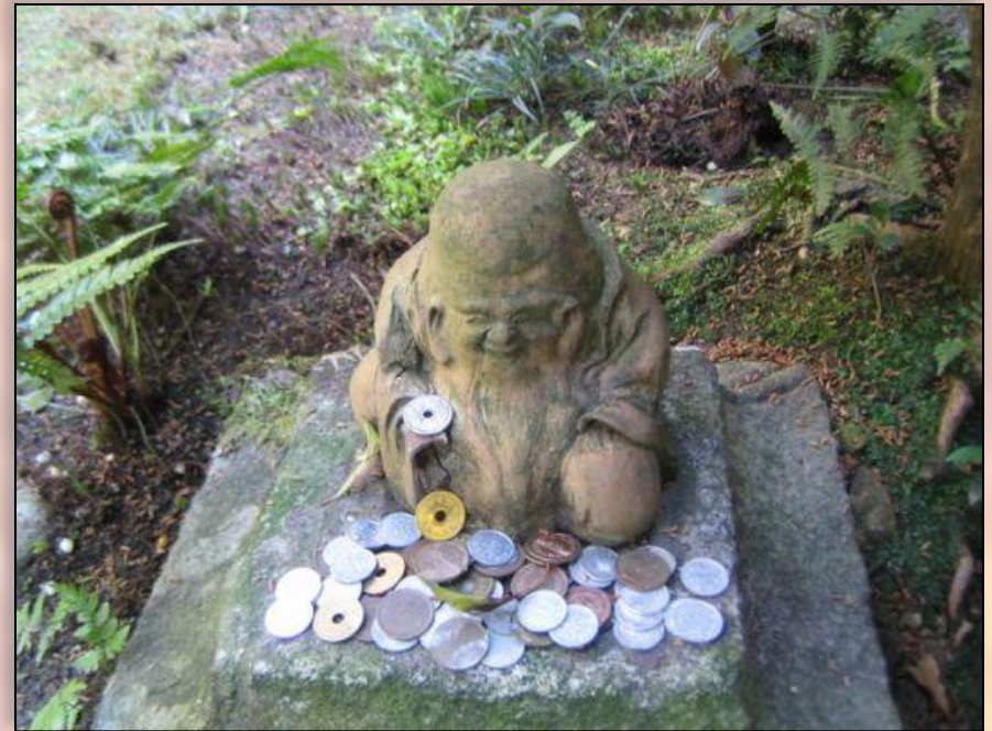
Рисунок этот сопровождал статью о финансовом положении Японии, о том, что она стала главным кредитором в мире.

Маленький человечек с раскосыми глазами восседал на куче денег. С гордостью и удивлением взирал он на обступивших его людей, которые, протягивали к нему руки, просили: «Дай! Дай!». Это представители разных континентов. Лица у них то белые, то смуглые, то совсем темные, волосы тоже разные: американским ежиком, то по-африкански курчавые.