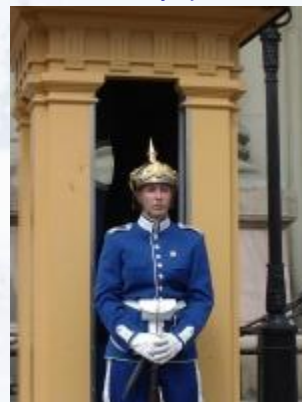
Почётный королевский караул