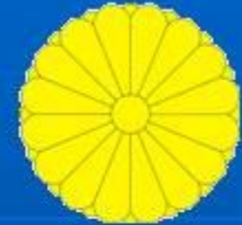
Государственный герб Японии