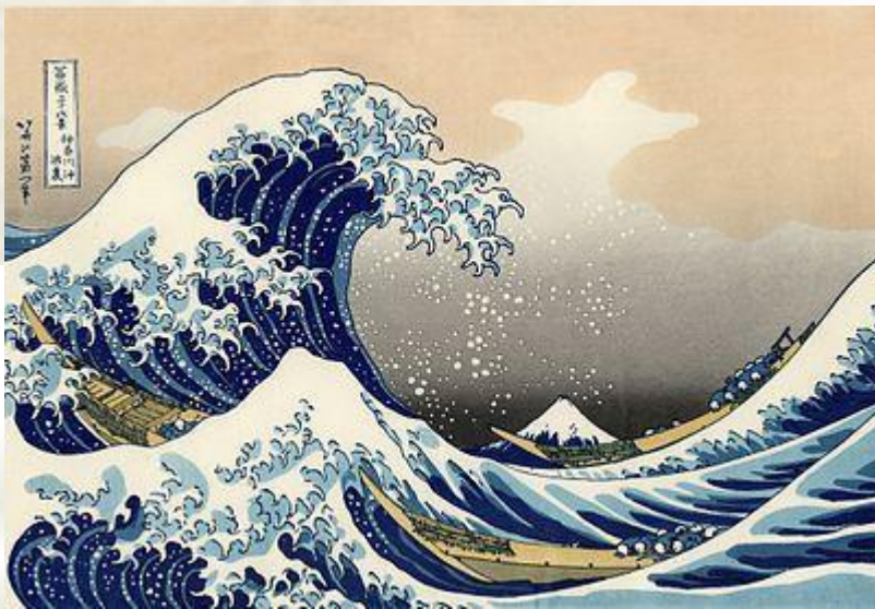
Кацусика Хокусай Большая волна в Канагаве , 1823—1831

Для японской живописи, характерно отведение ведущего места природе и изображение её в качестве носительницы божественного начала.