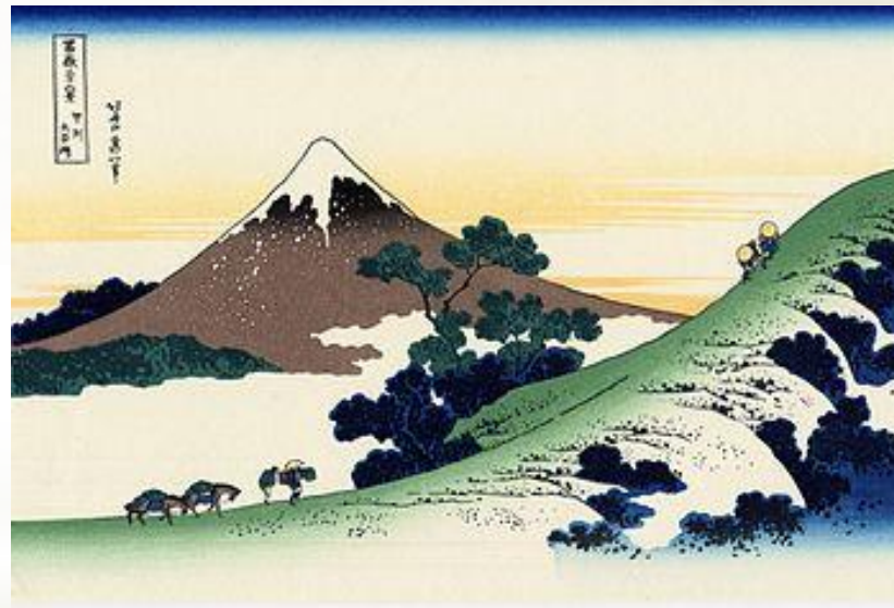
Кацусика Хокусай 36 видов Фудзи , 1830 г.