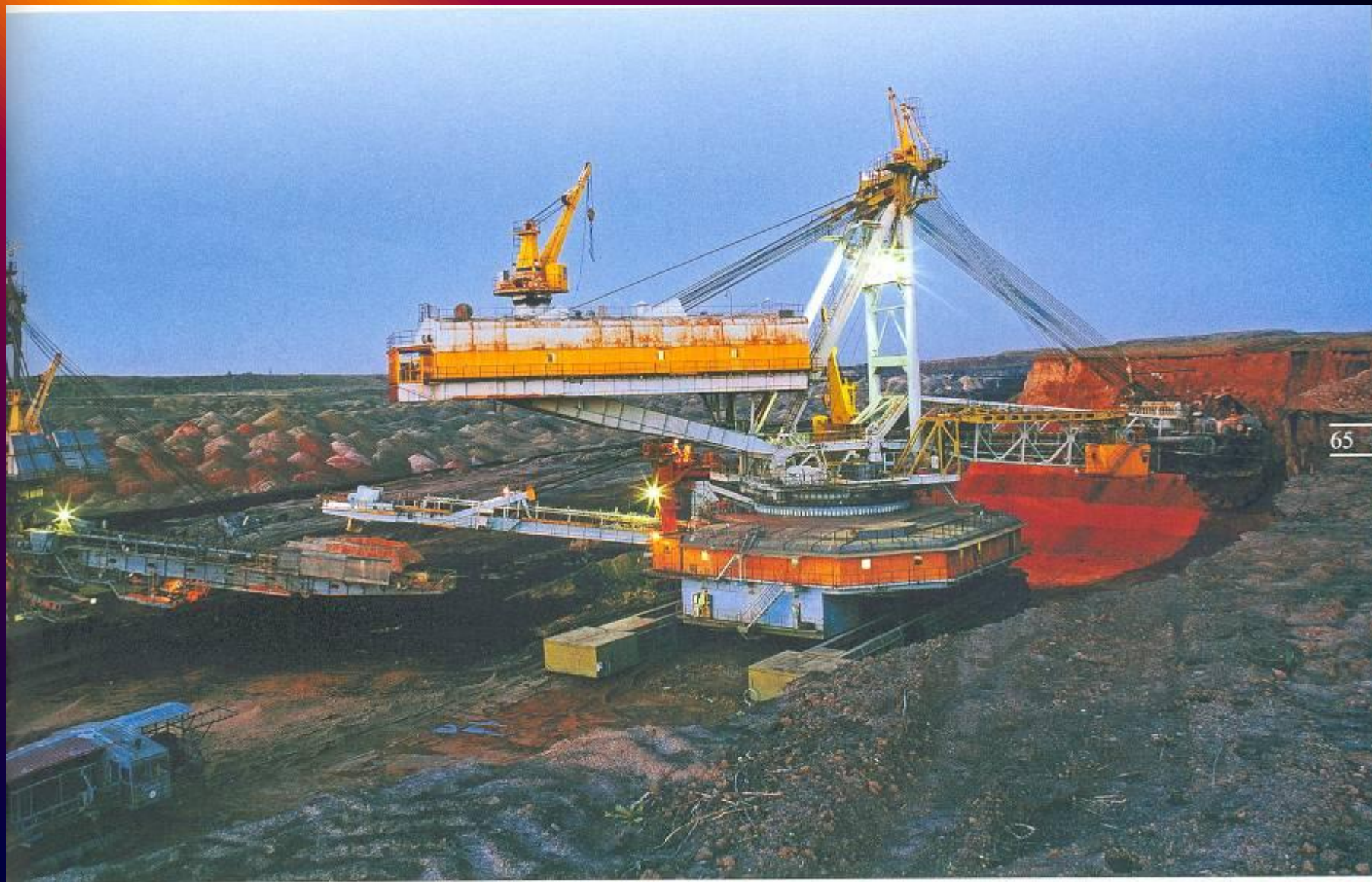
Добыча каменного угля открытым способом