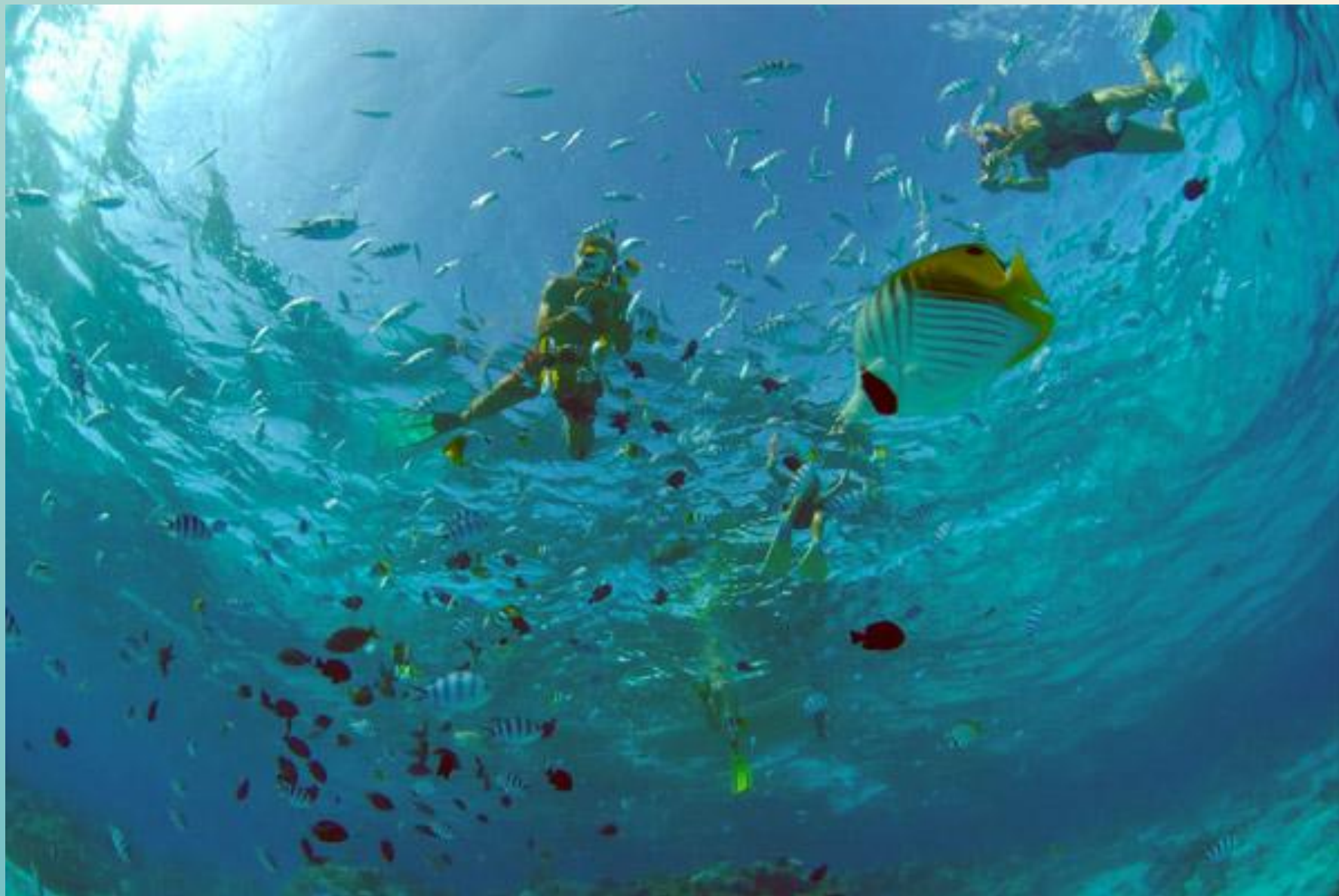
Дайвинг в море