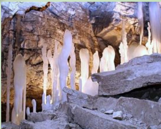
Кунгурская ледяная пещера