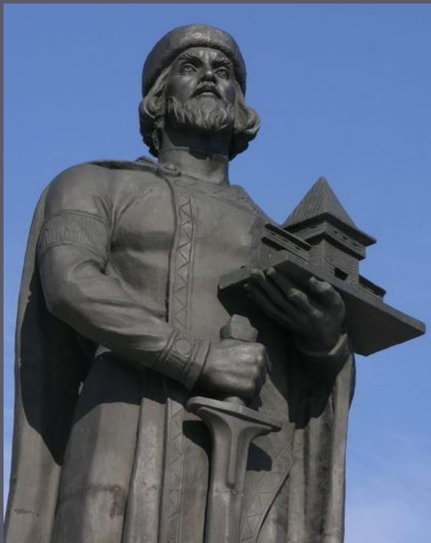
Памятник Ярославу Мудрому