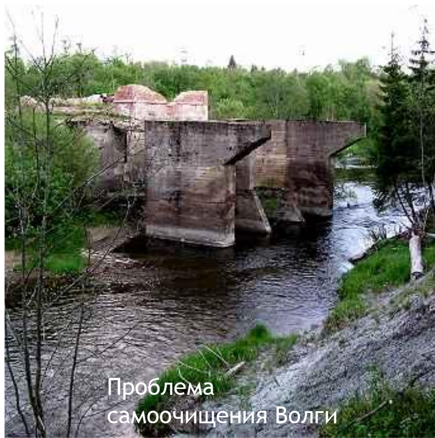
Проблема самоочищения Волги

В настоящее время в бассейне Волги сосредоточено около 45% промышленного и примерно 50% сельскохозяйственного производства России. Из 100 городов страны с наиболее загрязненной атмосферой 65 расположены в бассейне Волги. Объем загрязненных стоков, сбрасываемых в бассейны региона, составляет 38% от общероссийского.