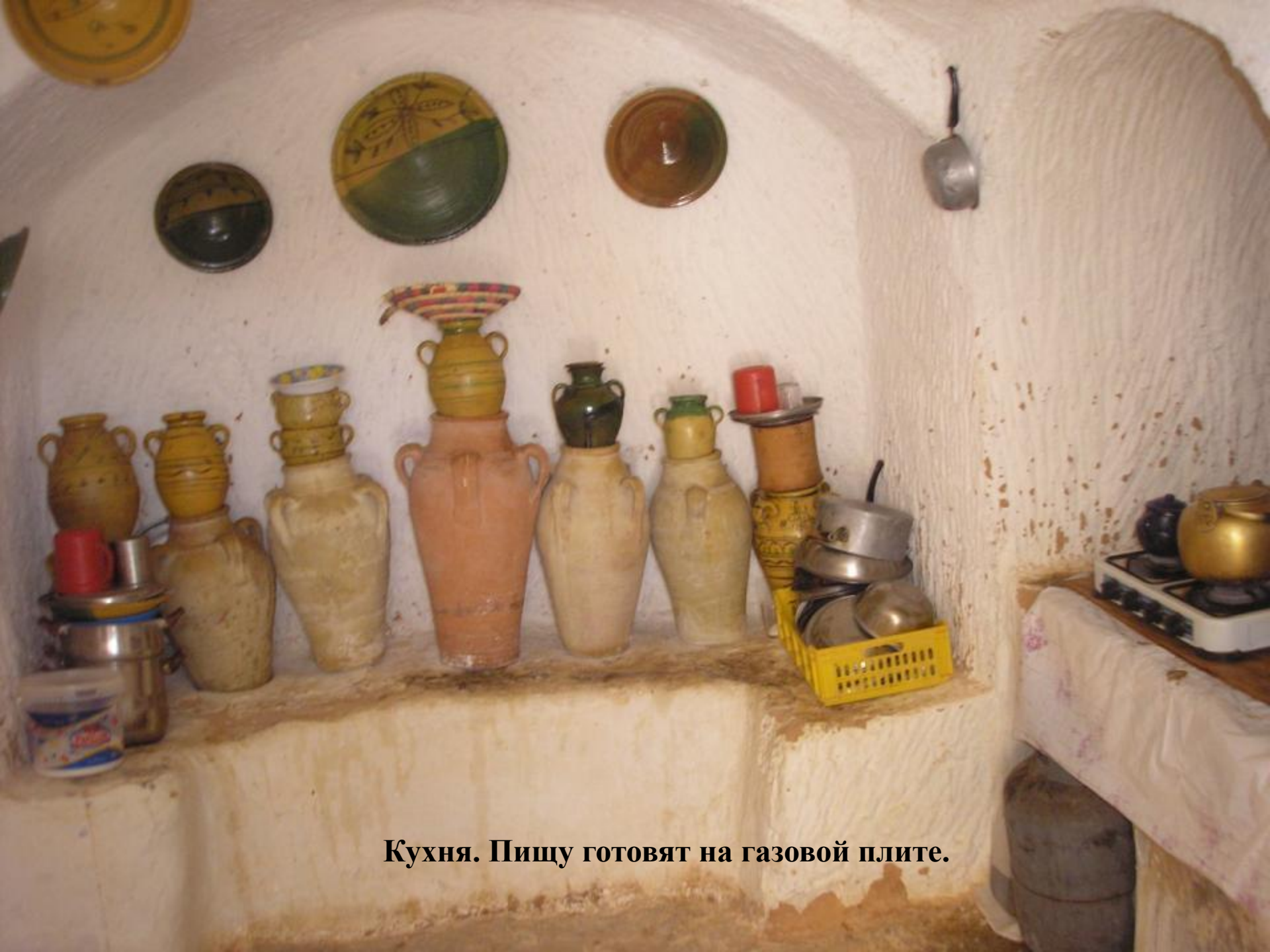
Кухня. Пищу готовят на газовой плите.