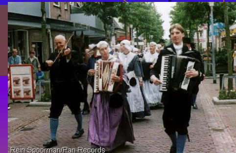
Rein Spoorman/Pan Records