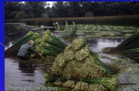
Christine Osborne Pictures