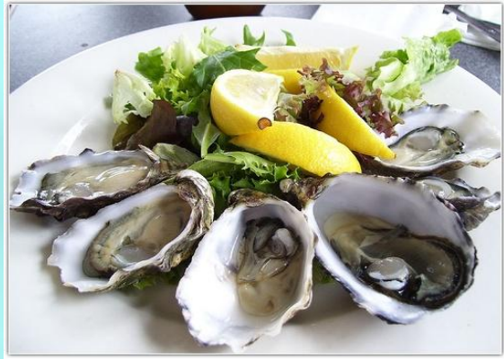
▣ Устрицы гребешок