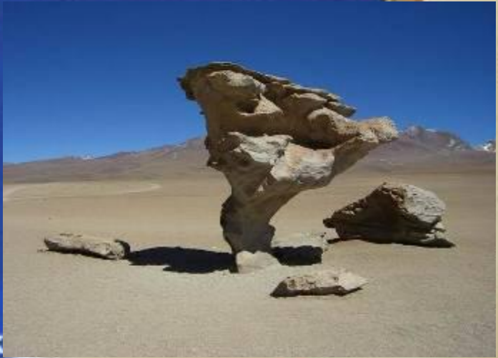
Название изображения: South America_054.jpg