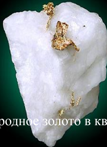
Самородное золото в кварце