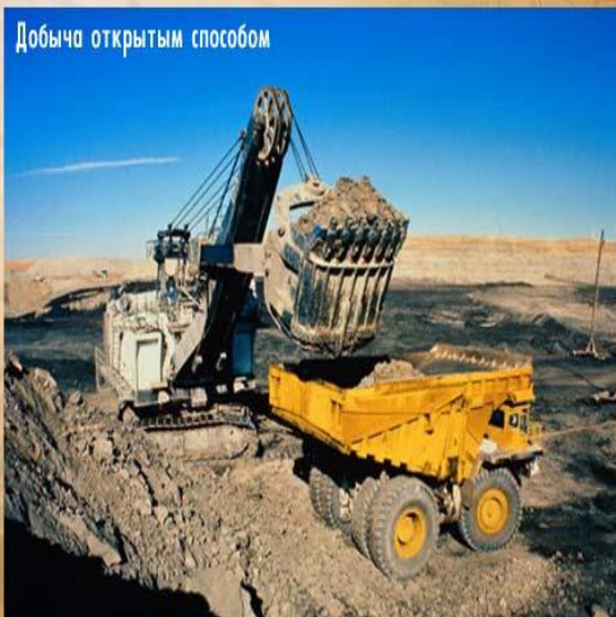
Добыча открытым способом