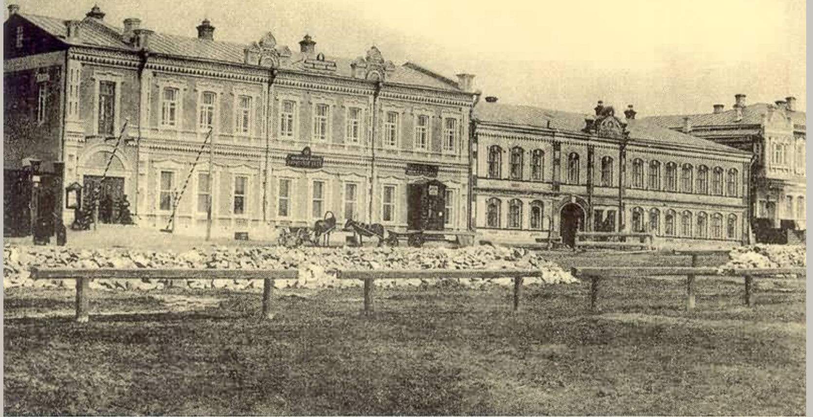
Новониколаевскъ Томск. губ. № 21. Зданіе Городскаго Управленія.