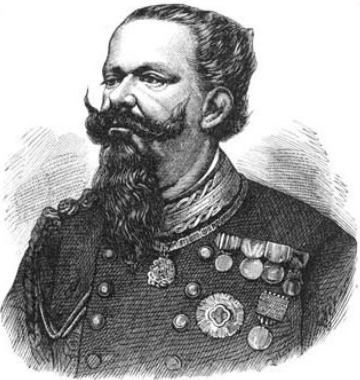
Виктор Эммануил II

Депутаты избирались из 2% жителей страны (мужчин старше 25 лет + имущественный ценз).