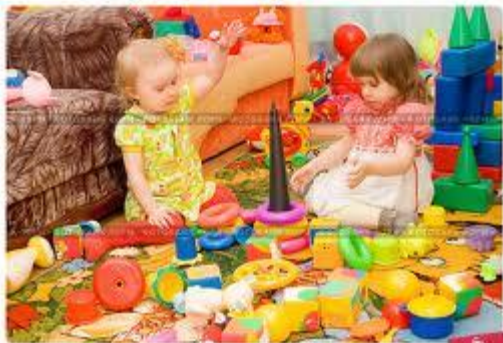
Двое детей играют в детской комнате