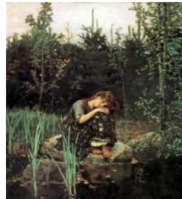
«Алёнушка» 1881 г.