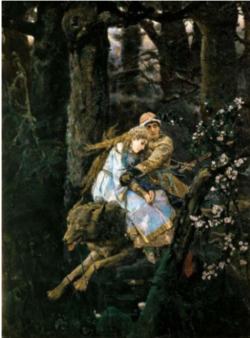
Иван-Царевич на Сером Волке