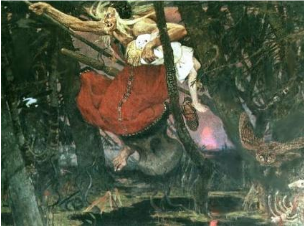
В.М. Васнецов Баба - Яга