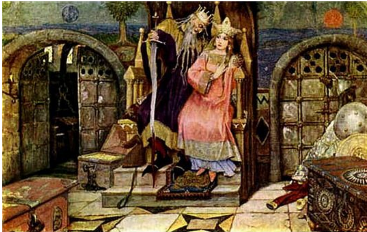
В. Васнецов. Кощей Бессмертный..