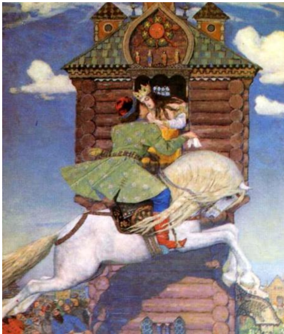
Васнецов В. М. Сивка – Бурка.