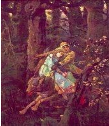
«Иван-царевич на сером волке» 1889 г.