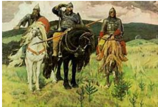
«Богатыри» 1898 г.