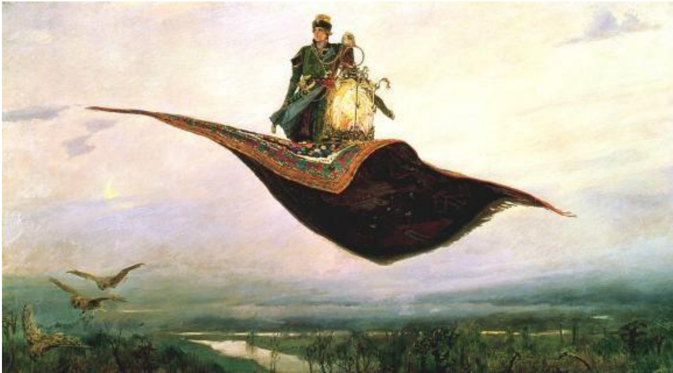
В.М. Васнецов. Ковер-самолет.

В чудесном небе своего детства изобразил Васнецов парящий как сказочная птица ковер-самолет. Герой - победитель в нарядном одеянии гордо стоит на ковре, держа за золотое кольцо клетку с добытой Жар-птицей, от которой идет неземное сияние. Земля отходит ко сну.