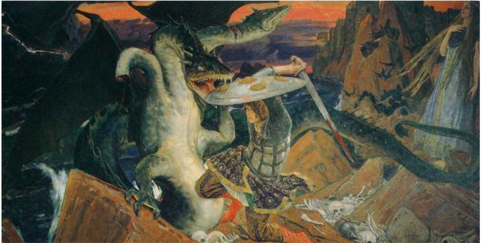
Бой Ивана-Царевича с трехглавым змеем