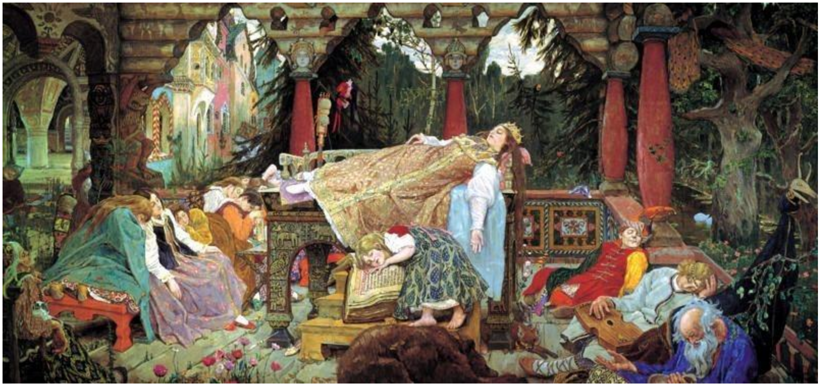
Васнецов В. М. Спящая царевна,