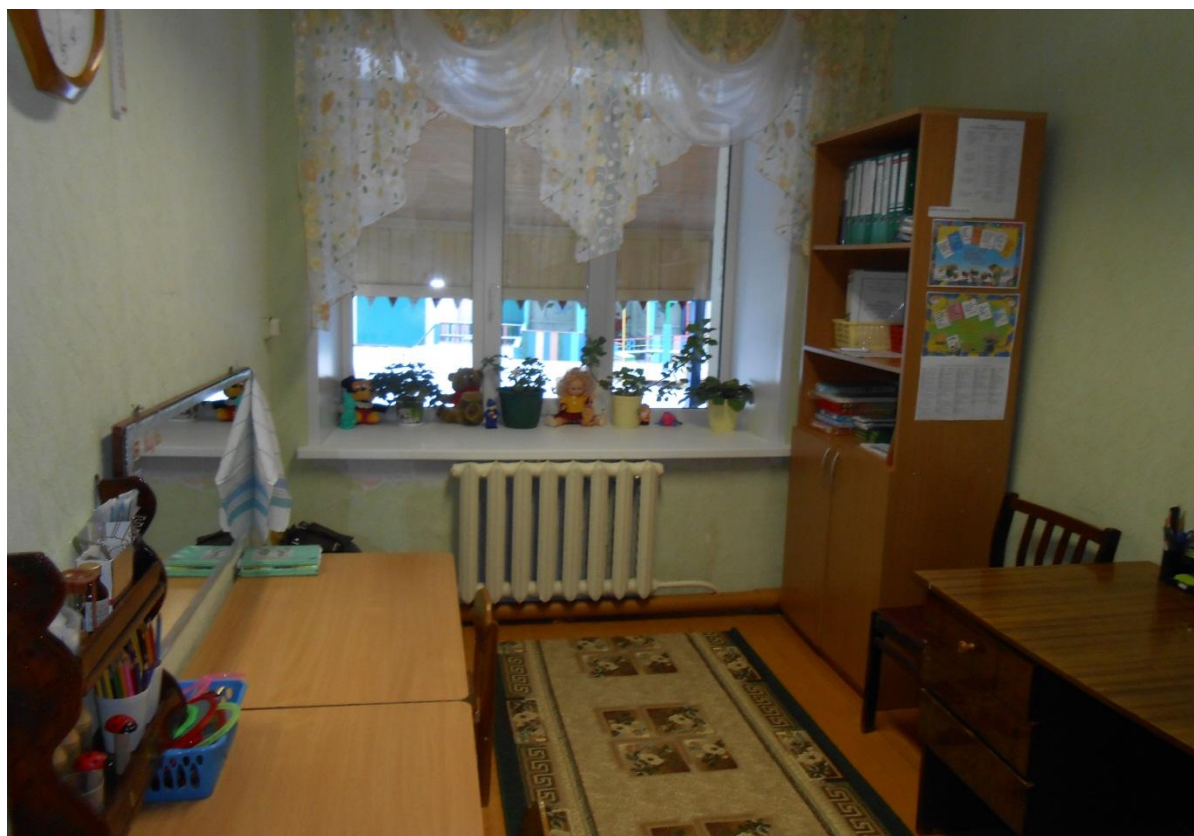
Общий вид кабинета