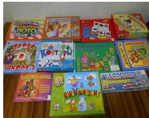
Зона дидактического сопровождения