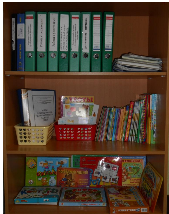
Зона методического сопровождения