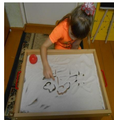
Зона психологической разгрузки