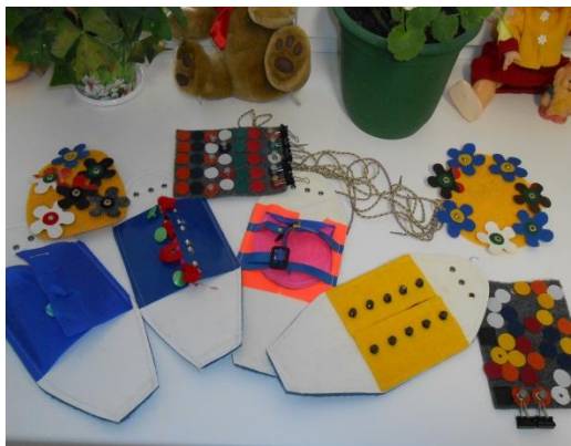
Зона развития мелкой моторики