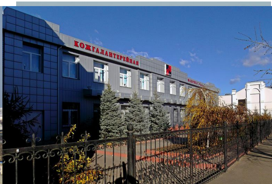
Троицкая ГРЭС Кожгалантерейная фабрика