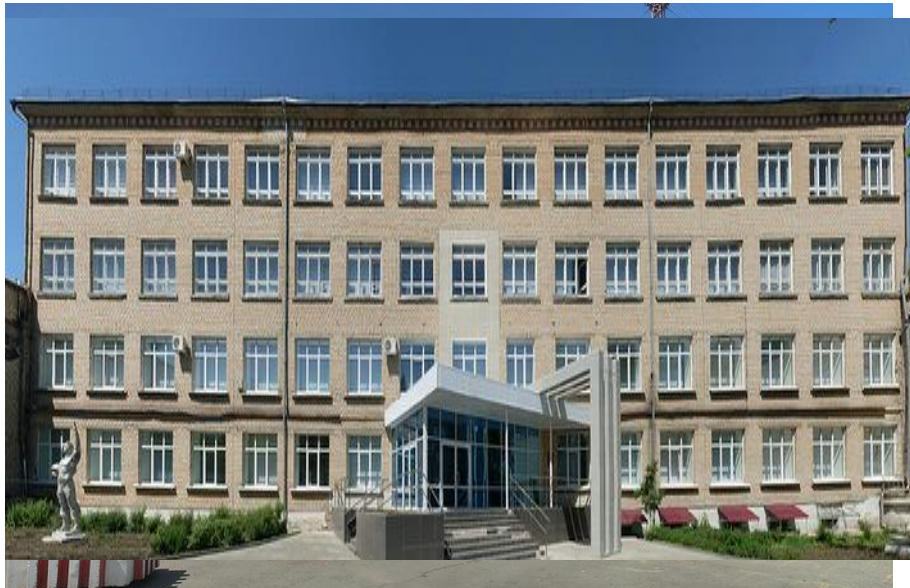
Авиационный технический колледж Уральская государственная академия ветеринарной медицины

В городе находится Уральская государственная академия ветеринарной медицины. Филиалы Челябинского государственного университета и современного гуманитарного института. Авиационный технический и педагогический колледжи, энергостроительный и аграрный техникумы, медицинское училище.