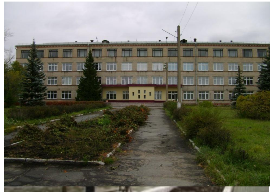
Энергостроительный филиал технического техникума Челябинского государственного университета