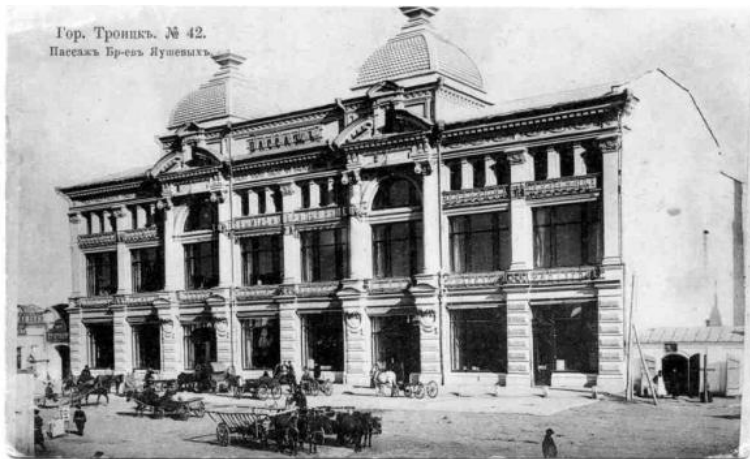
Пассаж Бр. Яушевых