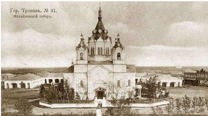
Гор. Троицк. № 41. Михайловский собор.

В 1879 г. открылась первая библиотека в Оренбургской губернии.