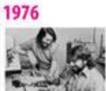
1976 Стив Джобс и Стив Возняк зарегистрировали фирму Apple

Компания Apple, один из пионеров на рынке ПК, по сей день сохраняет технологическое и дизайнерское лидерство в своей области