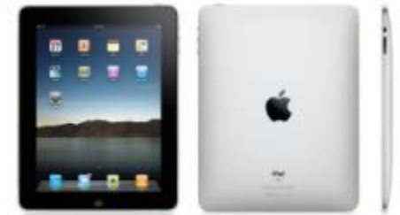
В 2010 году на рынок был выпущен планшетный компьютер iPad.

В августе 2012 она стала самой дорогой компанией в истории, побив установленный в декабре 1999 г., на пике т. н. пузыря доткомов, рекорд Microsoft, а 21 сентября 2012, акции Apple в ходе торгов достигли своего максимума — $705,07, капитализация составила $662,09 млрд. Со времени максимума в сентябре 2012 года к январю 2013 года капитализация Apple сократилась на 37,6 %, что позволило ExxonMobil вновь соперничать с ней за первое место самой дорогой публичной компании мира. 13 ноября 2014 года вновь Apple побила свой рекорд, ее капитализация составила $663,43 млрд.