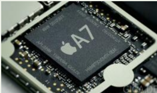
2013 году корпорация Apple первой начала серийное производство 64-битных чипов ARM-архитектуры выпустив 64-битный 2-х ядерный микропроцессор Apple A7