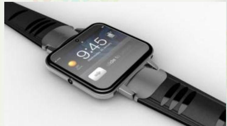
В 2014 году корпорация представила своё первое персональное, носимое устройство — Apple Watch.