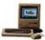
1984 Macintosh – первый компьютер с графическим интерфейсом пользователя (вместо интерфейса командной строки)