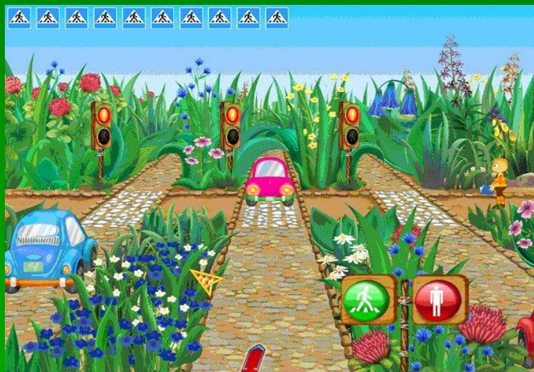
Рис.3 Пример игры-симулятора «Правила дорожного движения»

4) Ролевые Цель героев – исследовать виртуальный мир и выполнить поставленную в начале игры задачу. Задачей может быть отыскание определённого клада.