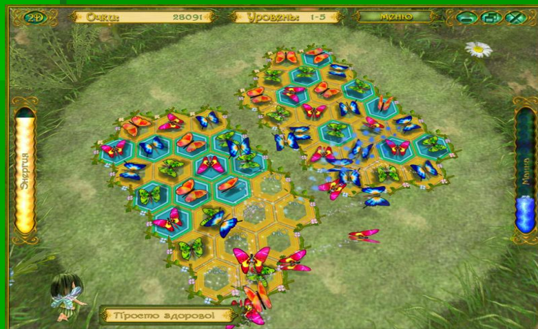
Рис.2 Пример логической игры «Сказочная история»