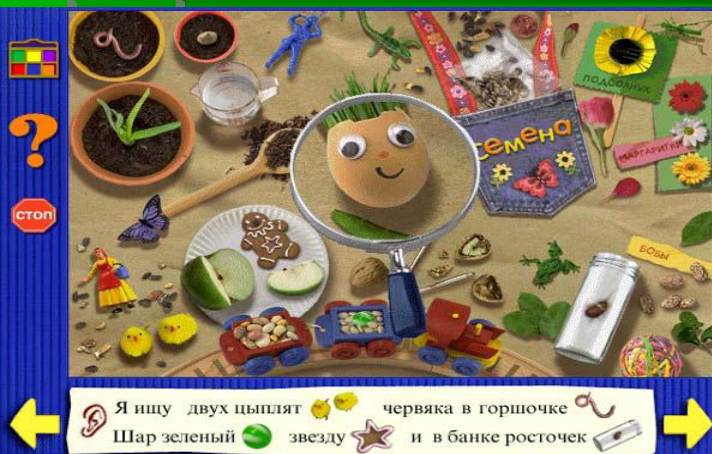
Рис.4 «Маленький искатель»

Для самых маленьких создана серия CD-дисков "Маленький искатель" (Scholastic Inc.) (рис.4) - игры для детей от 3 до 5 лет. Игра представляет собой рифмованные картинки-загадки и мастерски сложенные головоломки, обучающие чтению, стихосложению, азам математики и многому другому