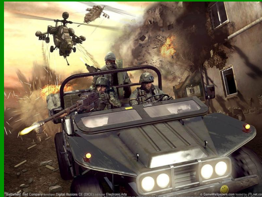
Рис. 1 Пример одной из стратегических игр